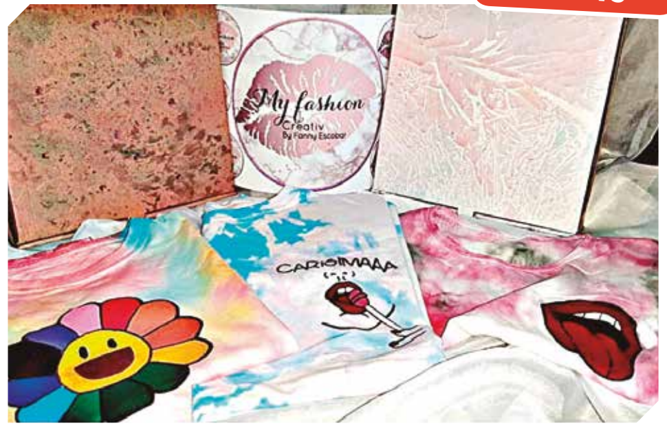
Cajas, remeras, prendas para niños y mucho más se encuentran disponibles en la tienda online.

● DATOS Pedidos al 0983 737-506 En el corazón de la ciudad de Limpio: Ruta PY03 Km 25,5