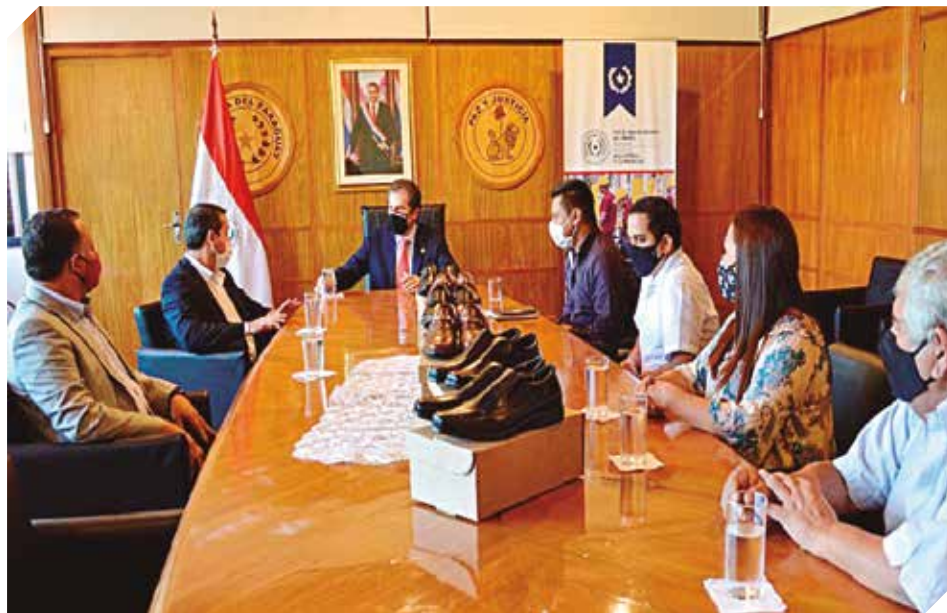
Fabricantes de calzados se reunieron con representantes del MIC.

La semana pasada, emprendedores nucleados en