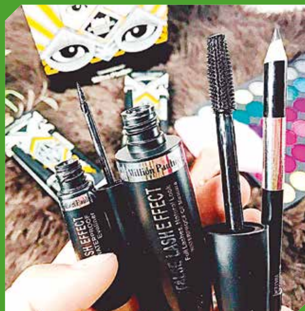
Las clientas eligen sus productos por la durabilidad.