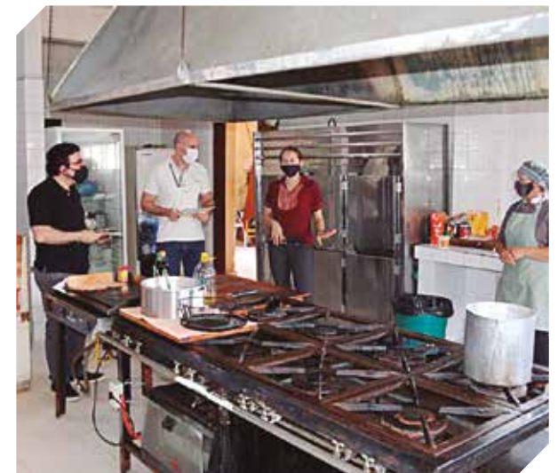
El curso es un requisito para acceder al sello Safe Travel.

El curso se realiza a través de la plataforma Campustur de la Senatur. Tras culminar la capacitación, se otorga un certificado de participación. Los interesados pueden inscribirse en el sitio web de la Senatur ( www.senatur.gov.py ).