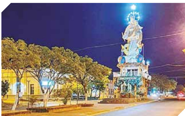
Buscan fortalecer a microempresas de Concepción.

Las microempresas seleccionadas accederán a capacitación empresarial en áreas de administración y gerenciamiento, entre otros aspectos.