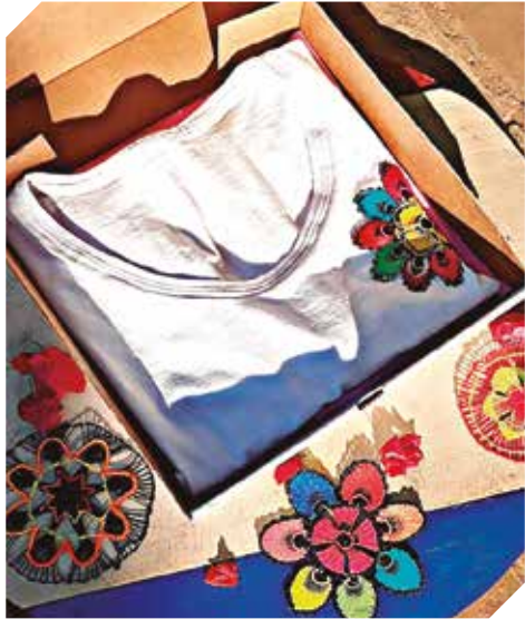
Los apliques de fiandutí le da un realce especial a cada prenda.