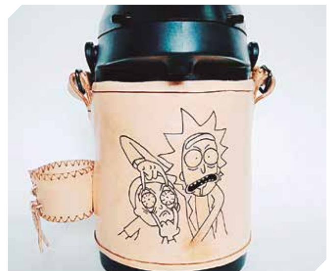
Termos para mate y tereré con motivos especiales.