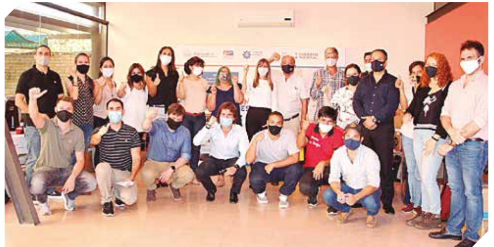
Parte del plantel de ganadores que busca implementar nuevas herramientas en el sector.

das a los beneficiarios del Proyecto Paraguay Poguapy – Componente 2 Acción Mipymes son: ventas y facturación, inventario, compras, costos, recursos humanos, información contable, etc.