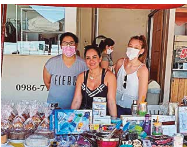
Espacio pensado para la integración del sector emprendedor.

Se instalarán 20 stands para que cada expositora ofrezca sus productos en los rubros de prendas de vestir, calzados, maquillajes, perfumes, comestibles, productos artesanales, manualidades, tejidos, plantas y una amplia variedad de rubros y servicios. El propósito del encuentro es empoderar a las mujeres emprendedoras y contribuir a la generación de ingresos.