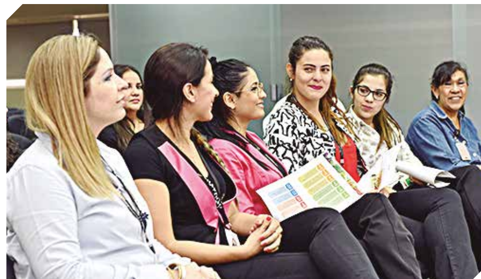
Las participantes tuvieron momentos de networking, sorpresas, regalos y un coffee break.