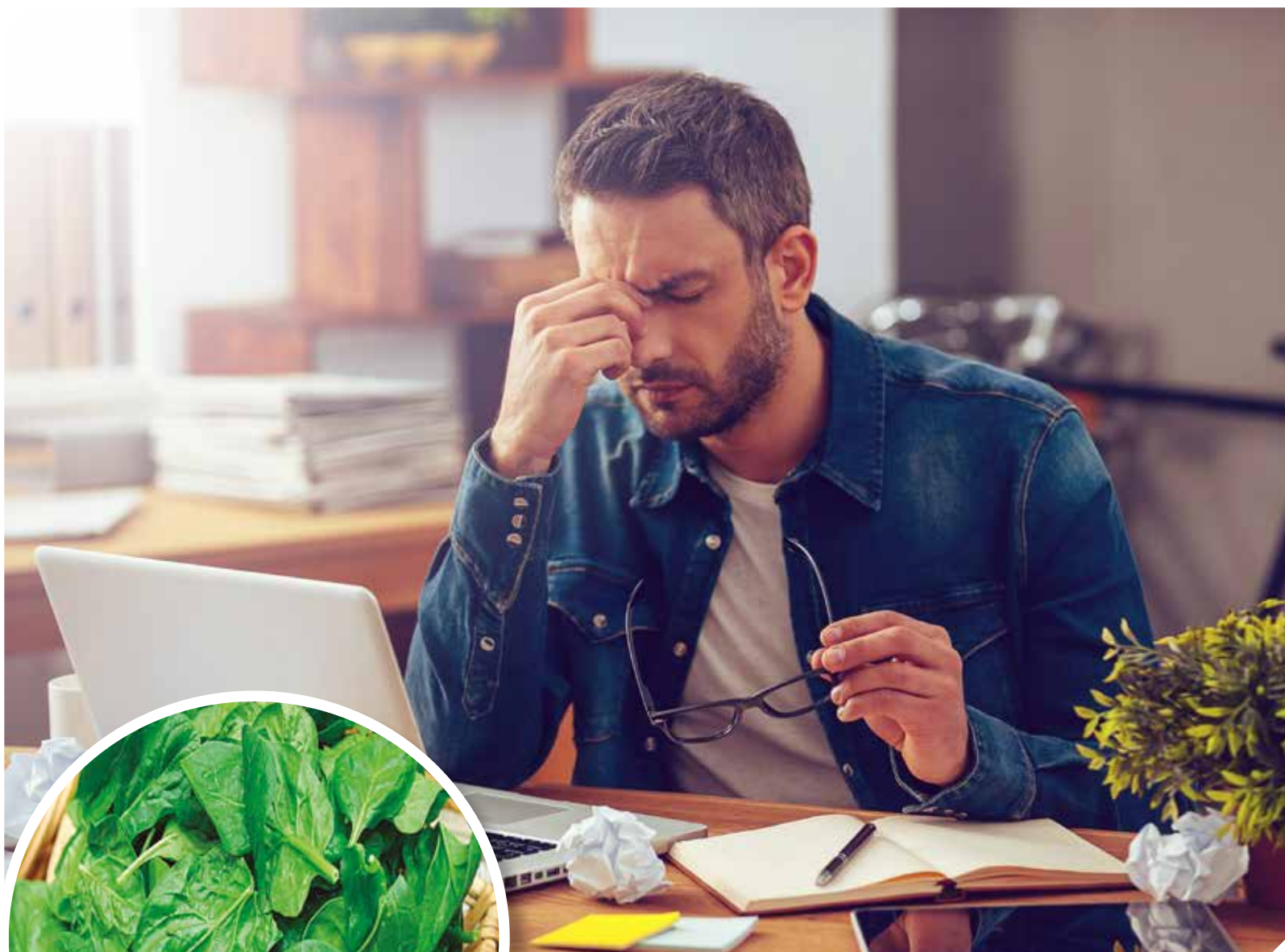
Las largas horas de trabajo, la falta de sueño son factores que afloran esta enfermedad.

Nos interesa tu opinión. Escríbinos a: ✉ lectores@gentedeprensa.com.py