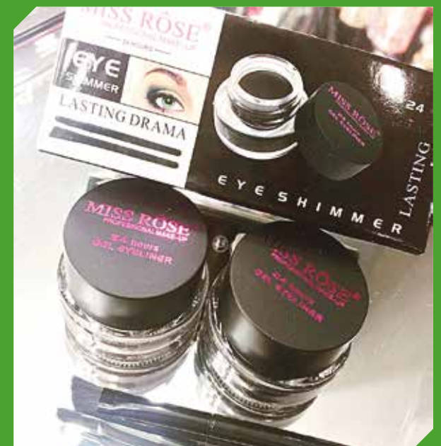
La tienda también trabaja con clientes mayoristas.