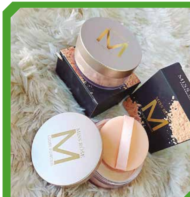
Los productos se adaptan a todo tipo de pieles.