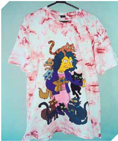
Remeras personalizadas con precios accesibles.