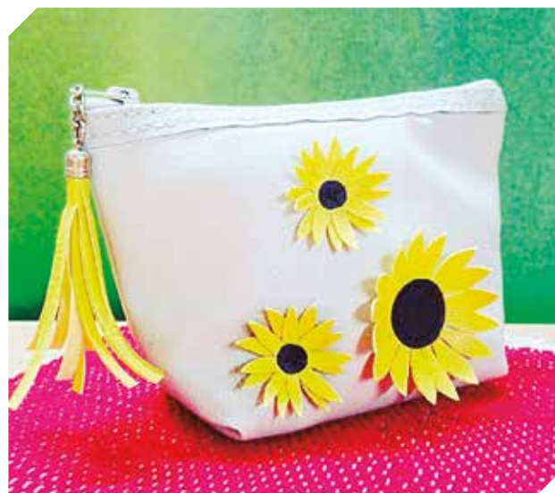
Para el kit completo y ordenado en este cómodo neceser.