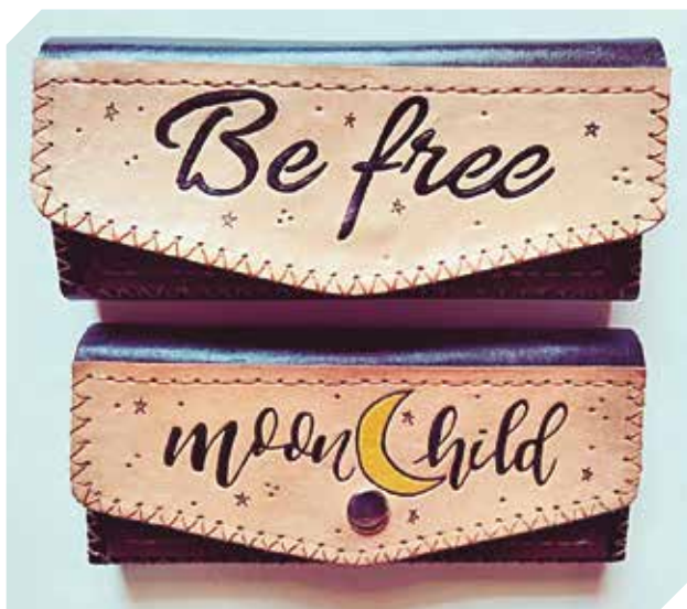
Ofrecen una variedad de billeteras personalizadas.