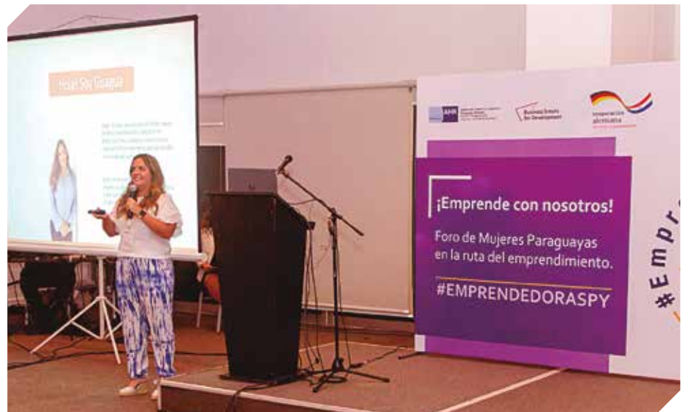
Este taller contó con la presencia de varias referentes del sector del emprendedurismo.