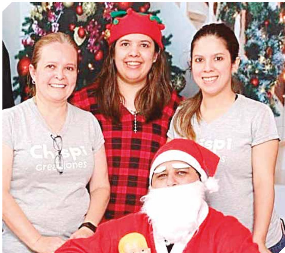
Del sueño a la realidad, el negocio propio que logró darle vuelta la vida a una familia.

La aparición de la pandemia obligó a las emprendedoras a reinventarse a jugarse por más productos, y de ahí le dan mayor énfasis a la creación de artículos para todo tipo de eventos, como tortas con motivos especiales, adornos dulces para las mesas de even-