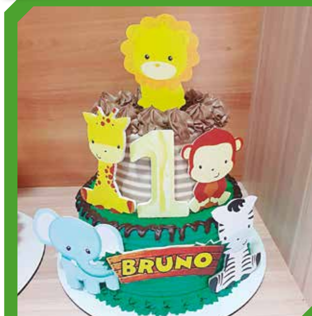
Las tortas con detalles especiales tienen precios accesibles.