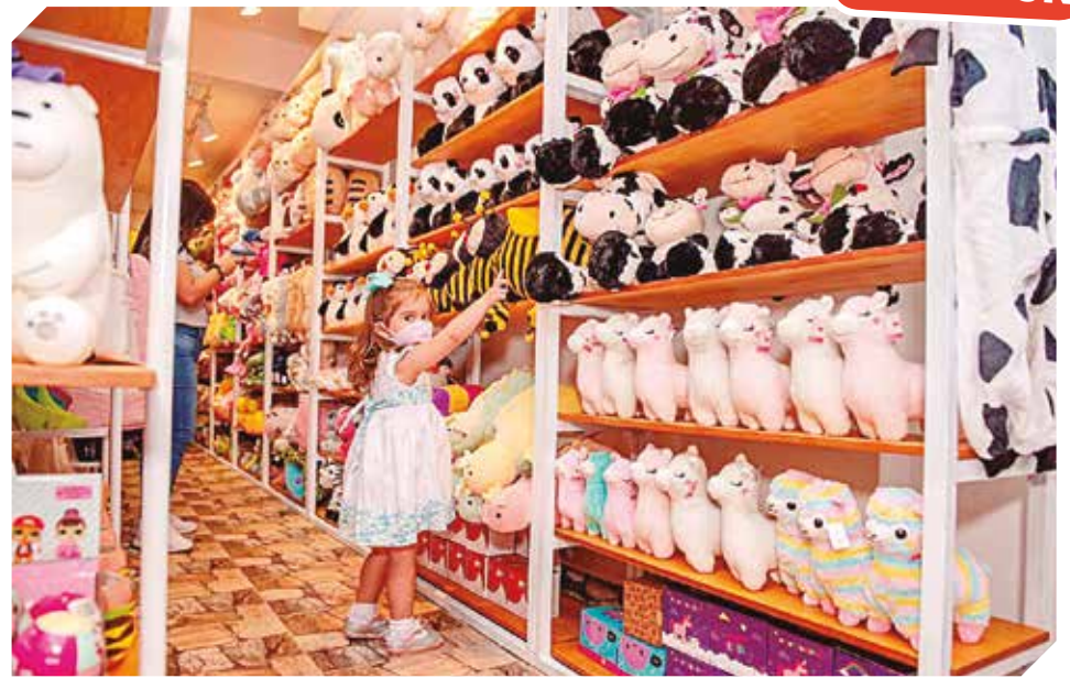
Productos para niños, jóvenes y adultos de todas las edades a buen precio con calidad.

las edades visitan el lugar para adquirir algún producto en especial.