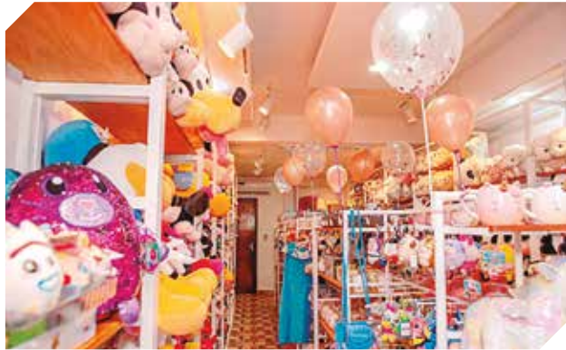
Peluches originales de importantes marcas internacionales.