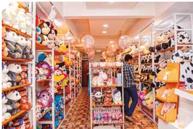
Descuentos especiales al realizar compras al por mayor.

Boopillows se destaca en la venta de peluches de todos los diseños y formas como personajes de Disney, Cartoon, animales creativos, frutas, entre otros. Además de los peluches cuenta con productos varios como agendas, tazas, alfombras y artículos escolares.