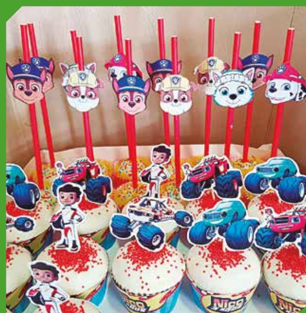
Se encargan de que cada pedido sea exclusivo y de calidad.