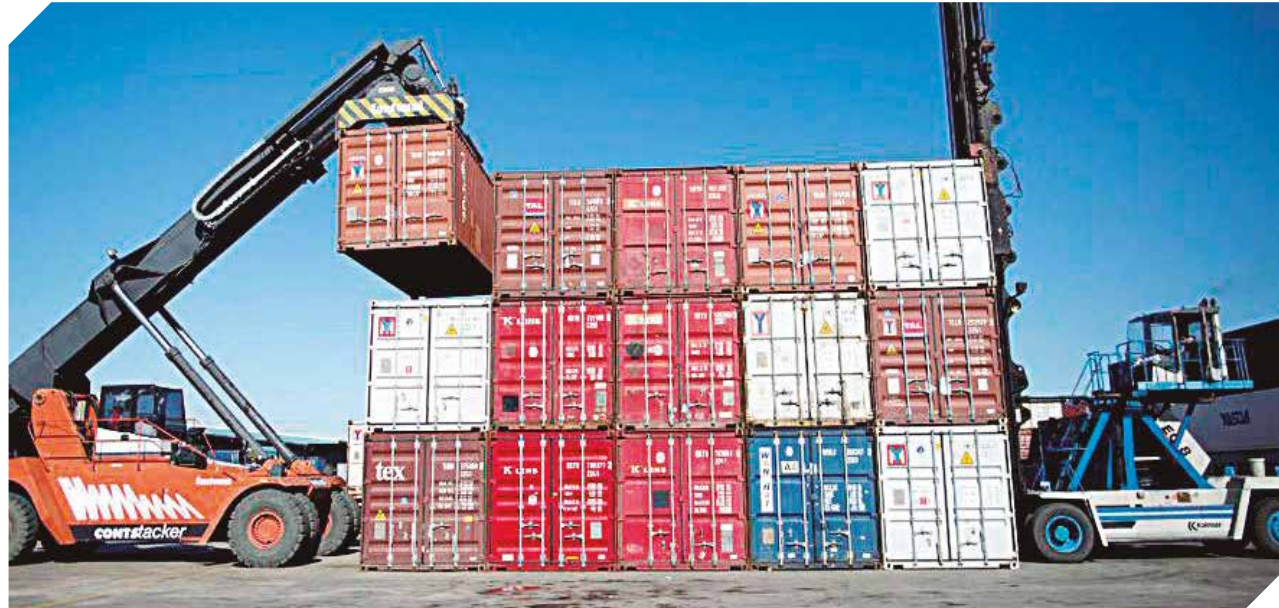
MIC y BID acordaron trabajar en el potenciamiento de las exportaciones de las mipymes.

Un programa vigente de Mejora de las Capacidades Empresariales brinda apoyo