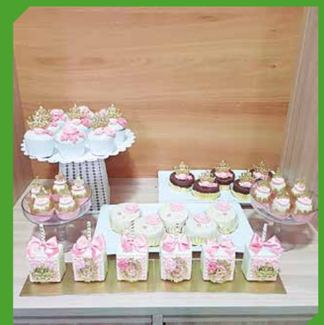
Para bautismos y bodas, adornos personalizados.