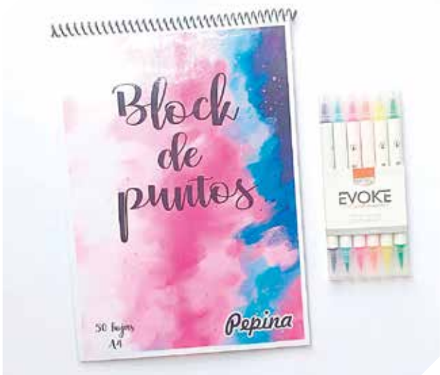
Diversidad de productos para dibujar y colorear.