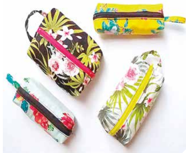
Cartucheras pintadas a mano con diseños exclusivos.