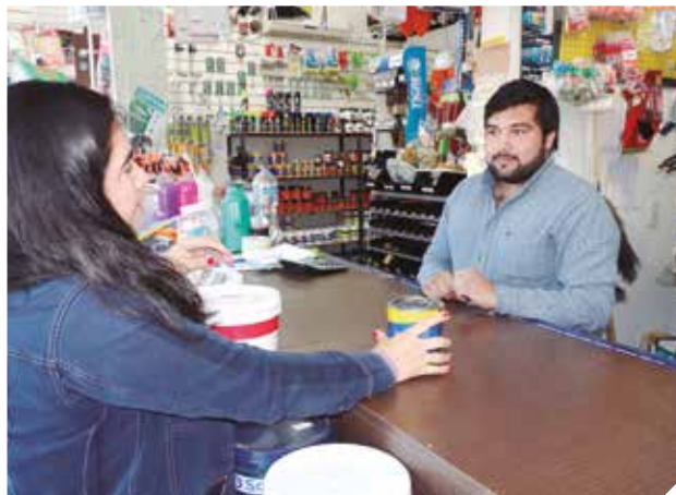
El método de compra va evolucionando de forma acelerada.

"No obstante, es necesario realizar un esfuerzo adicional y dar continuidad al uso de esas cuentas. Esto se puede lograr con una Ley de Inclusión Financiera (LIF), la que permitirá asegurar los avances positivos en materia de inclusión financiera", dijo.