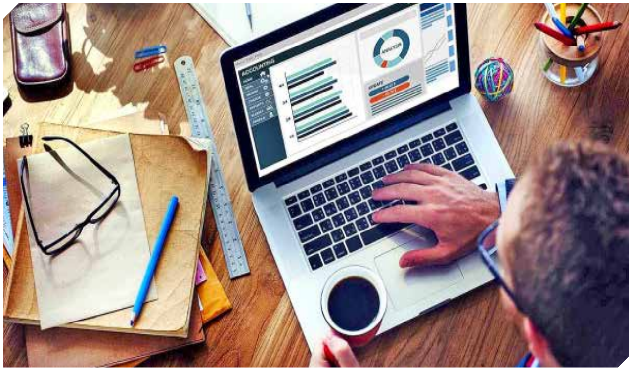
Organizaciones quieren dinamizar la economía local a través de trabajos digitales.

Valemi es el proyecto que busca vincular a micro y pequeñas empresas, beneficiarias y proveedores, a fin de acercar herramientas para elevar las ventas en los negocios.