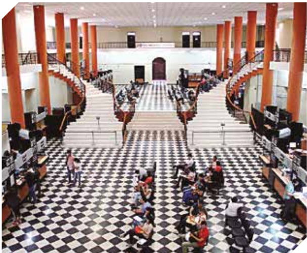
La SET anunció facilidades para contribuyentes.

También, a partir del 1 de mayo, la página web de la SET contará con una opción para ingresar las solicitudes de reactivación del RUC cancelado. Con estas actualizaciones se espera mayor agilidad y facilidad para los contribuyentes.