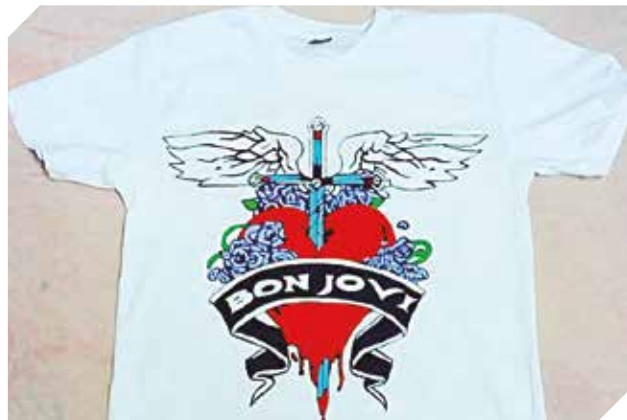
Confeccionan y realizan remeras con motivos especiales.

M andi'o Style es una tienda online dedicada a la serigrafía artesanal con diseños exclusivos pintados a mano. Una de sus cualidades tienen que ver con su estilo bien tradicional paraguayo. El emprendimiento se especializa en pintar remeras, buckets, jeans, shorts, calzados, camisas, sábanas y vestidos y darles al público una excelente presentación cumpliendo con todas las exigencias requeridas diariamente, hasta de los visitantes más exclusivos.