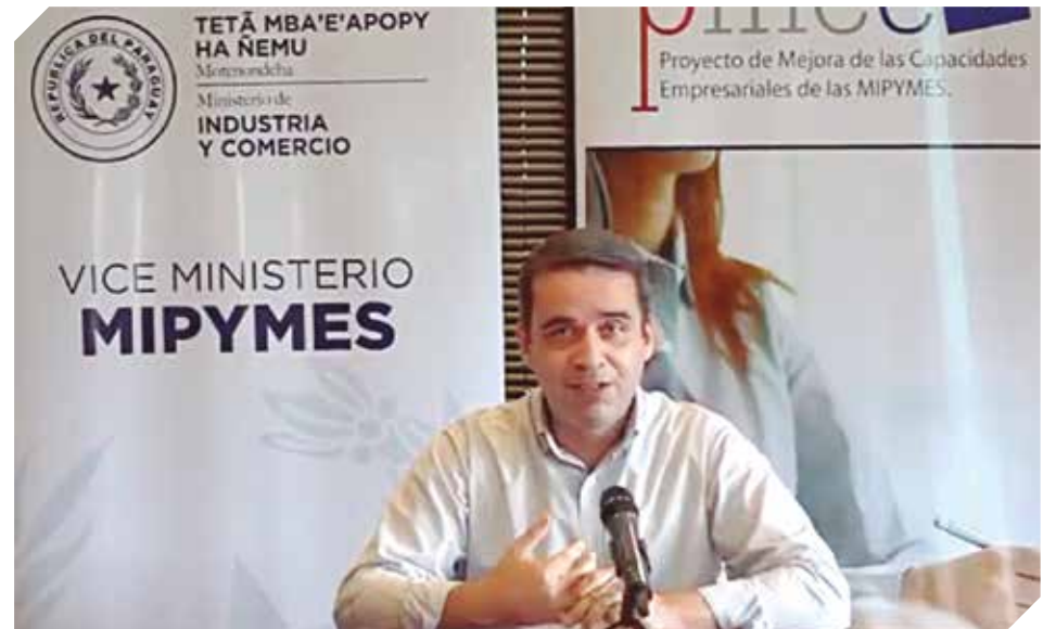
El objetivo es fortalecer e impulsar el desarrollo de las pymes formalizadas.

Los cursos se iniciarán el 16 de febrero, a través de la Plataforma de Capacitación a Distancia para Mipymes Formalizadas. El programa a desarrollar contempla la formación en gestión y administración de empresas, con una carga horaria de 100 horas. Además se incluye una etapa de asesoría técnica, también en la modalidad virtual. En