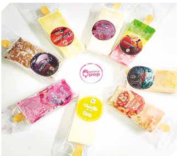
La diversidad de sabores es su principal atracción.