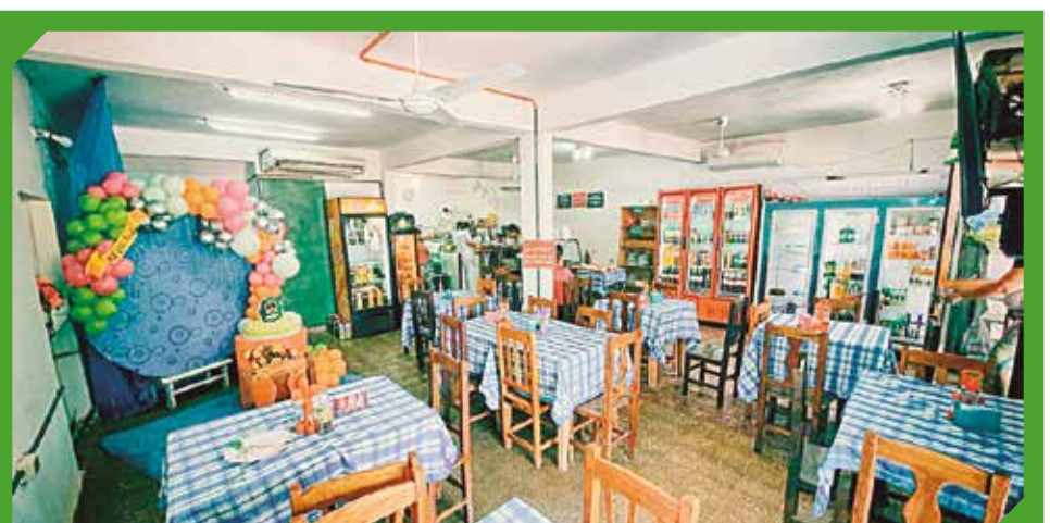
Che Kamba Dulces y Salados se encuentra en la Avenida Mcal. López 660.