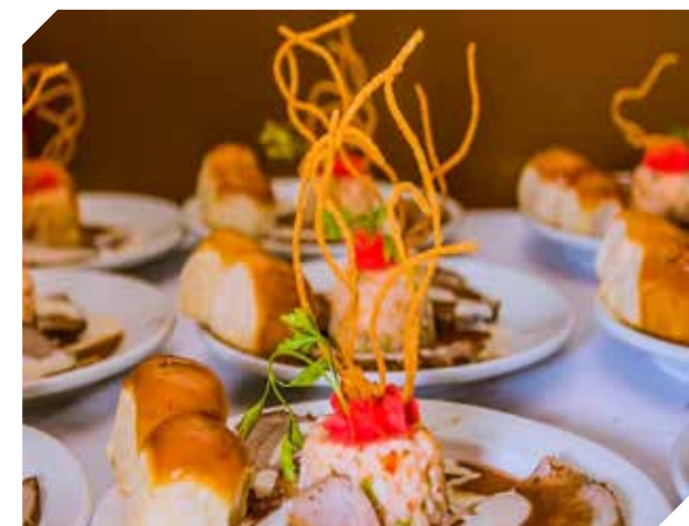
El local abre todos los días, de 6:15 AM a 1:00 AM.

Ambas marcas están en Facebook e Instagram, como @chekambapy y @chk-fastfood. Para más datos, los interesados pueden comunicarse al 0982 451-864.