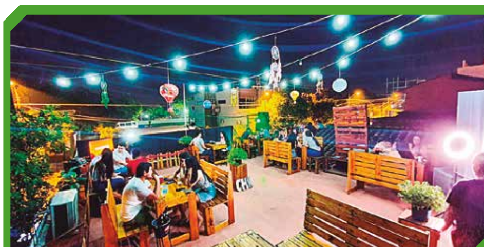
CHK Fast Food, el segundo emprendimiento gastronómico, tiene un año en el mercado.