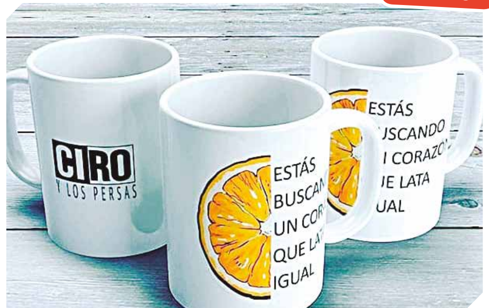
Tazas de todos los tipos y tamaños para el uso personal o para regalos empresariales.

Shirley Torres es la encargada y propietaria, detalla que trabajan con todo tipo de clientes, entre ellos los mayoristas. A partir de