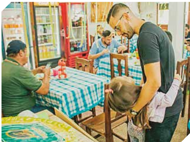
De la cocina francesa a un rincón de Villa Hayes.

Una tarde en el sur de Francia, a casi diez mil kilómetros de Paraguay, decidió volver a su tierra natal para iniciar un emprendimiento gastronómico y materializar un deseo familiar.