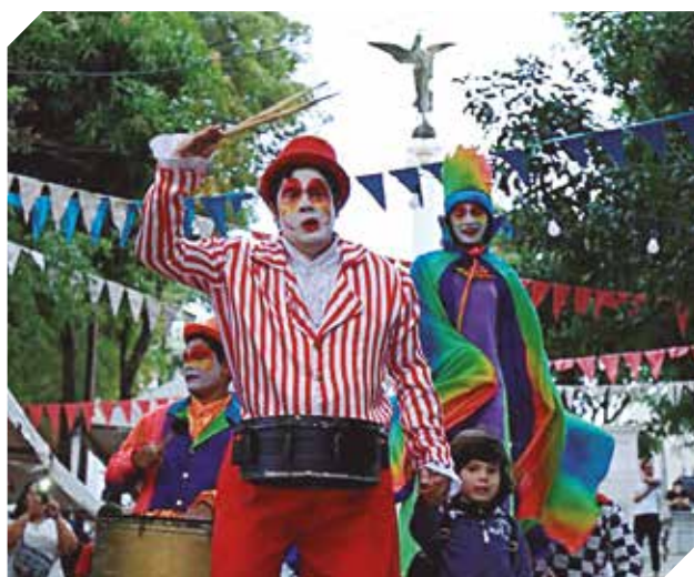
Promoción del arte y la cultura en la ciudad de Asunción.

El objetivo es potenciar la gestión cultural local en las diversas disciplinas, géneros y estilos artísticos, la Dirección General de Cultura y Turismo de la Municipalidad de Asunción convoca a artistas, gestores culturales, productores y ciudadanía en general a participar de la convocatoria Festivales de la Ciudad de Asunción.