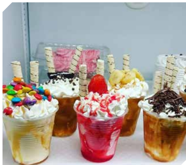
El mejor sabor para acompañar cada jornada.