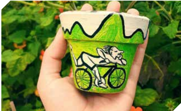
Para adornar el hogar con trabajos personalizados.