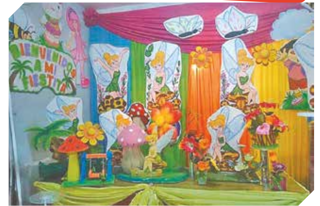
El cumpleaños deseado a cargo de profesionales.

● Ubicación: Acceso Sur y José Asunción Flores, en Ñemby.