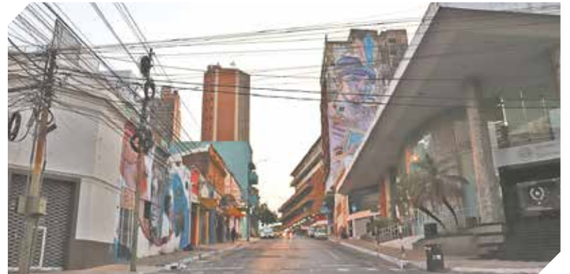
Así se ven las calles de la ciudad tras la restricción.