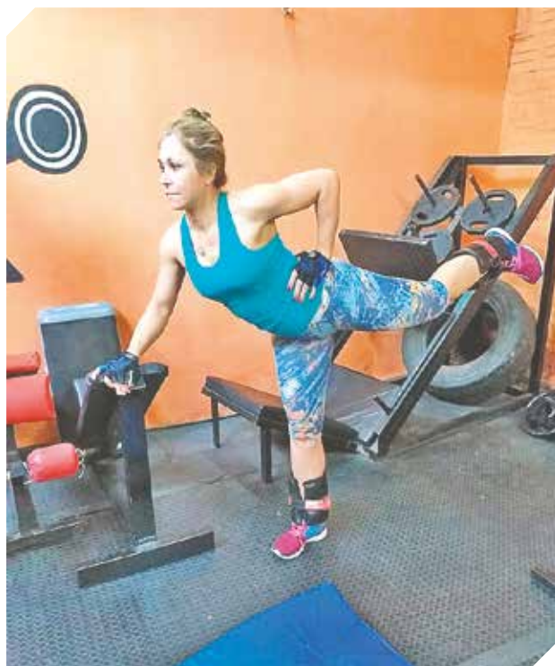
Sus alumnos tienen un constante seguimiento.