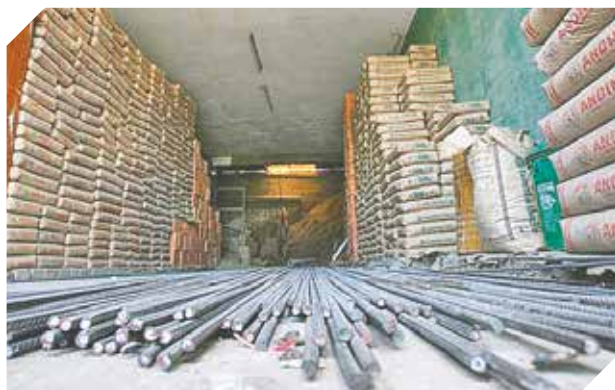
La calidad y la buena atención es garantía 100%.

Nos interesa tu opinión. Escríbenos a: lectores@gentedeprensa.com.py