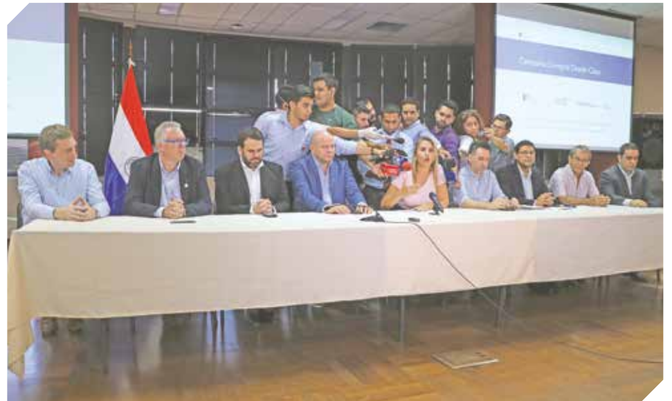
El MIC reunió a gremios empresariales para afrontar el nuevo escenario comercial.

Por otra parte, los comercios adheridos a la Red Infonet que prestan servicios de entrega a domicilio podrán comercializar sus productos hasta en tres cuotas sin intereses para sus clientes.