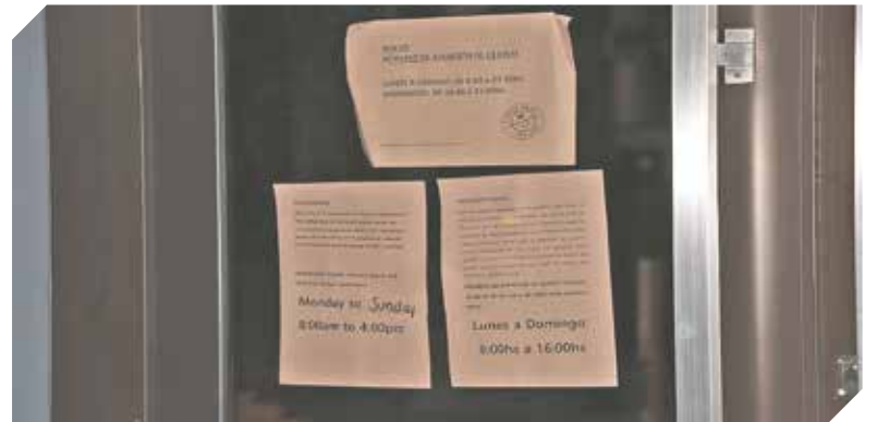
Los comercios informan a sus clientes el cierre temporal.

El pedido generalizado de este sector es contundente en el momento de solicitar alternativas o plazos para cumplir con las obligaciones financieras. El Estado ha implementado cuidados para preservar la salud de los paraguayos, pero descuida al