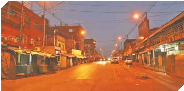
Pequeños comercios del Mercado N° 4 cumplen las medidas.

Es bien claro que el mayor capital de una organización es su recurso humano, teniendo en cuenta esta premisa muchas empresas se ajustan a las indicaciones. Sin embargo, existe un porcentaje que no logra adelantarse por la falta de garantías y la necesidad de generar ingresos para pagar salarios, y cumplir con las obligaciones.