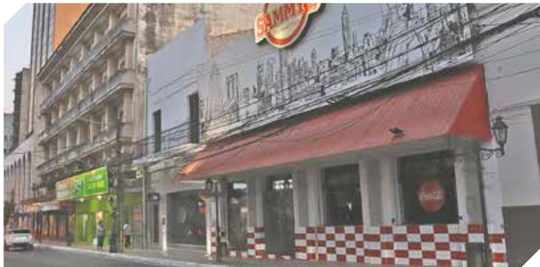
Los locales gastronómicos tienen menos clientes y genera pérdidas.