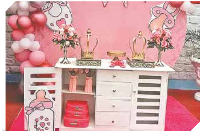
Los más lindos baby shower para las mamis.

climatizado sitio donde realizar todas las compras deseadas.