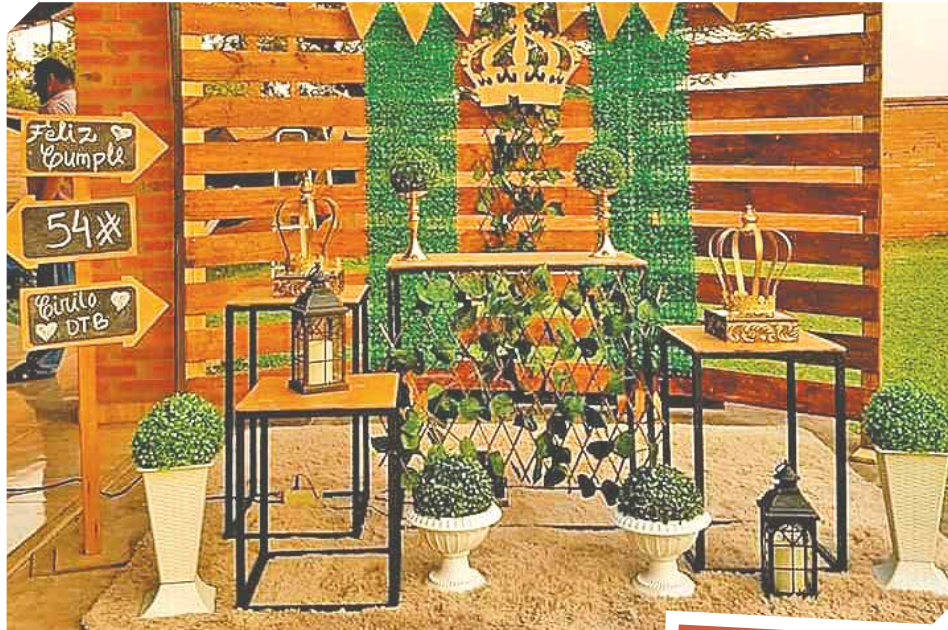
Para bodas y 15 años todos los mejores decorados.

Por otra parte Cotillón Mickey cuenta con la colaboración especial de un importante grupo de