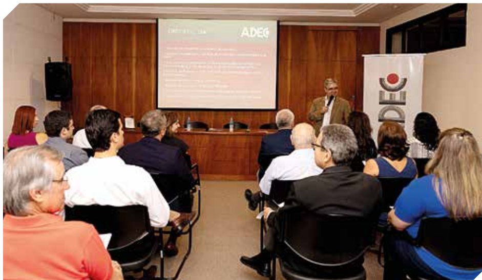
La Asociación de Empresarios brindará apoyo y asistencia a sus asociados.

En ese sentido es muy importante que el Gobierno apoye a las mipymes con medidas especiales o extraordinarias para ayudarlas, "Existen plazos que se deben cumplir y tasas de diferentes medidas regula-