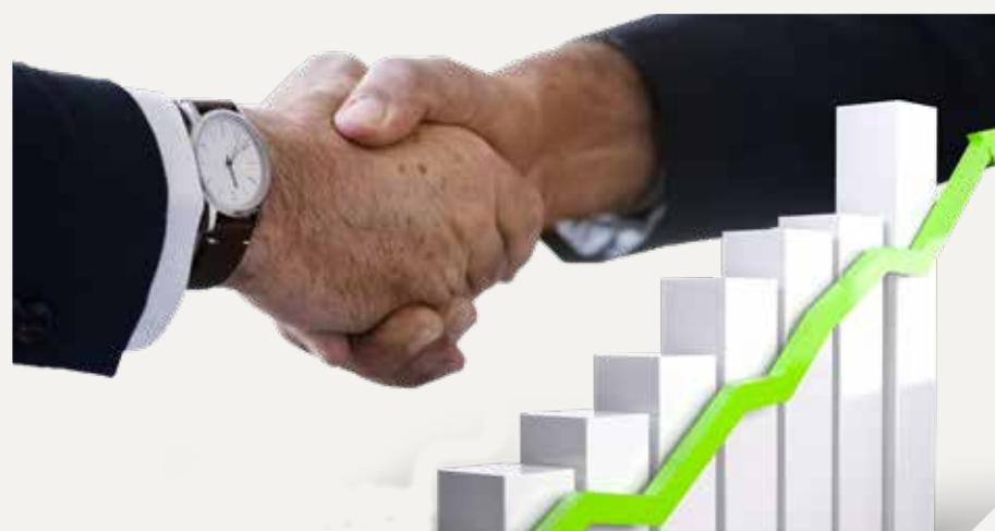
Para hacerle frente a la coyuntura, anunciaron líneas con tasas preferenciales.

avancen en la formalización y puedan aprovechar las distintas plataformas de pago electrónico. Esta situación, además, abre una ventana para el desarrollo creativo del sector. "El emprendedor sabe que una dificultad puede convertirse en una oportunidad", señaló Godoy.