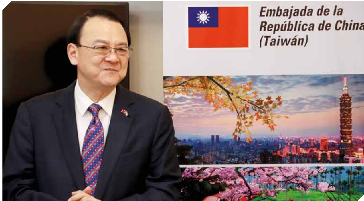
La decisión busca que los lazos comerciales entre ambos países se fortalezcan como muestra de amistad y sinceridad.

La carne bovina deberá cumplir ciertas condiciones sanitarias antes de ser exportada. Desde Taiwán enviarán de forma anual a un equipo de expertos, que se encargarán de verificar la eficacia que tengan las me-