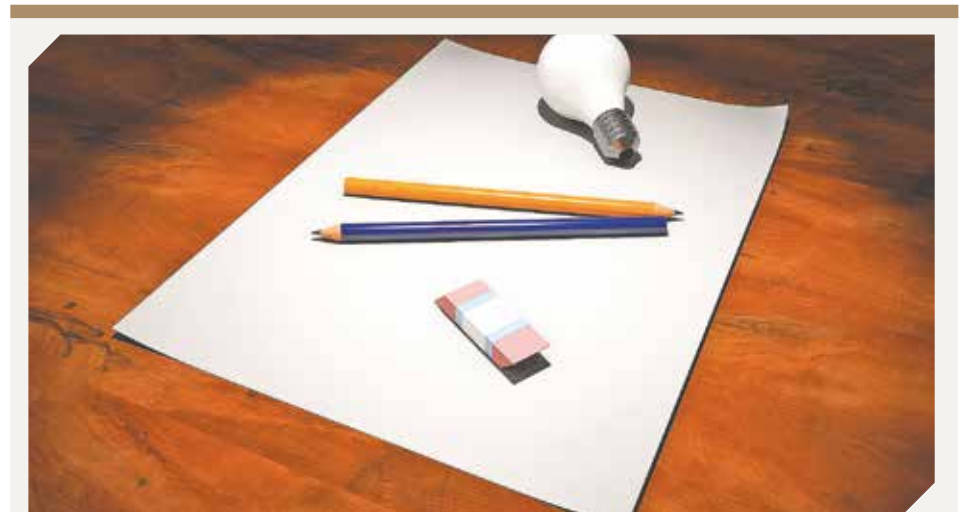
La situación abre las puertas a nuevos modelos de negocios.

Se espera que los bancos y financieras locales también se sumen, con líneas de crédito para el segmento.