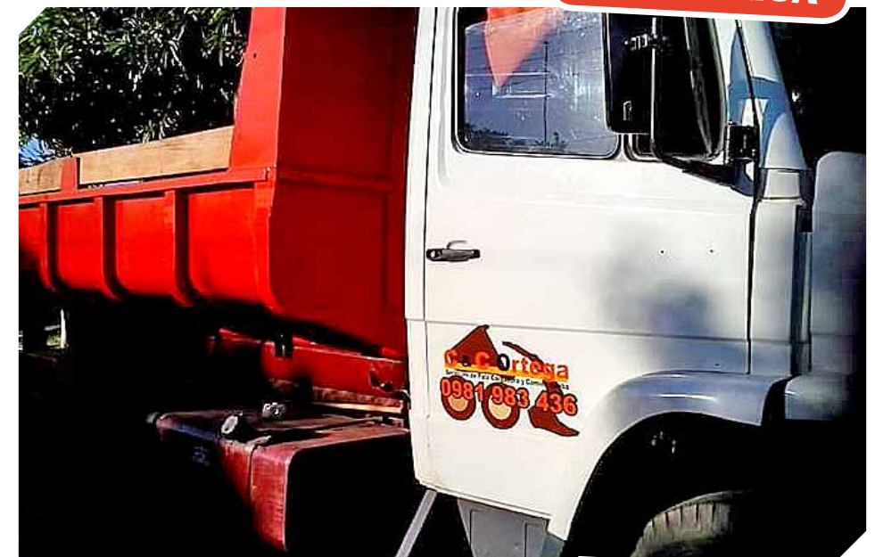
Los mejores materiales para los clientes fieles.

Los propietarios del local ofrecen precios especiales para todos los mayoristas que buscan