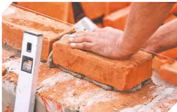
Para todo tipo de construcción ECI es la solución.