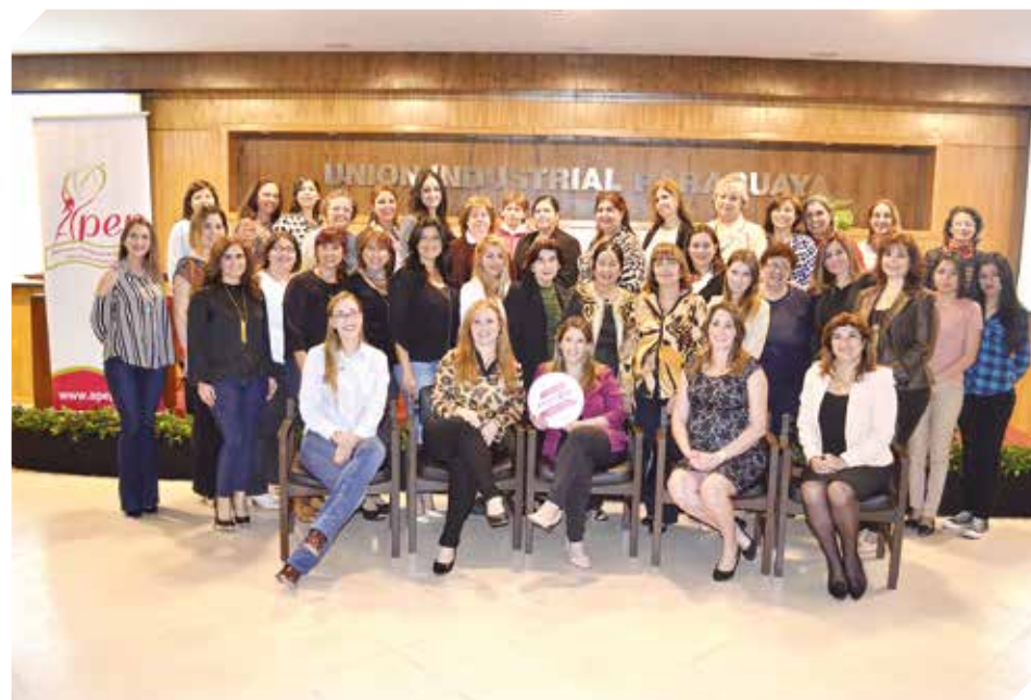
Las actividades serán reanudadas una vez finalizado el periodo de cuarentena.

petentes del área de trabajo y salud, muchas empresas tiene compromisos operativos, y sueldos que pagar a fin de mes y el gobierno tiene que trabajar en medidas y planes para que las mismas, especialmente las mipymes que son las más vulnerables no salgan tan afectadas", expresó. Asimismo, menciona que es un momento importante para reevaluar los roles como ciudadanos para plantear acciones concretas para lograr una sociedad comprometida con el bienestar y prosperidad de todos sus miembros. Lezcano resalta que es vital la colaboración entre el público-privado para buscar