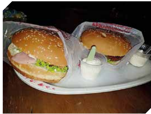
Las más ricas hamburguesas para disfrutar.

Todos los clientes serán atendidos de la mejor manera en el local.