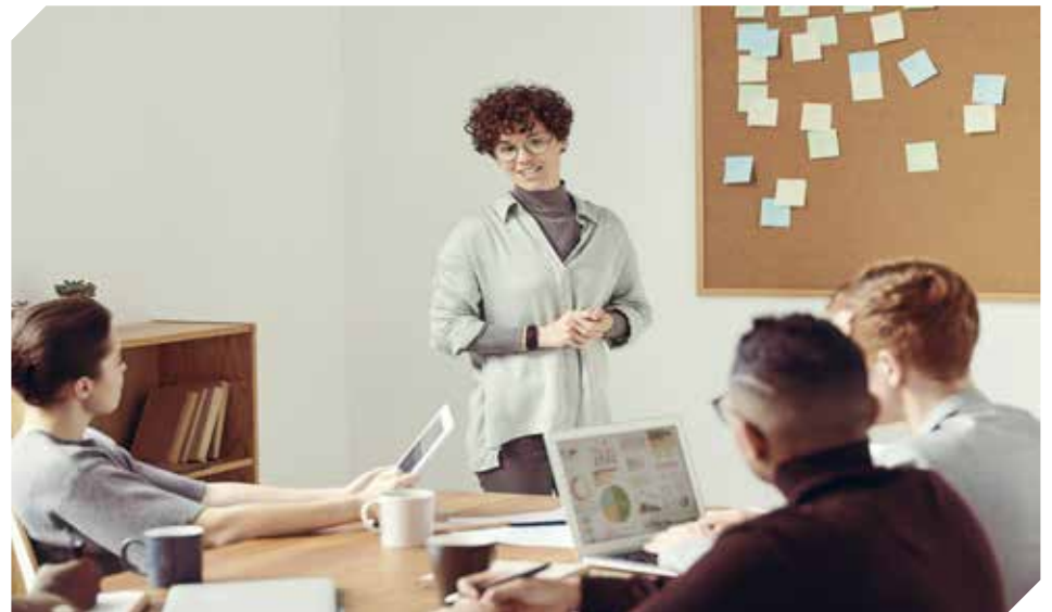
El estudio posiciona al país dentro de una clasificación a nivel mundial.

GEM comenzó en el año 1999 como una iniciativa de investigación donde participan investigadores de todo el mundo con el objetivo de analizar la actividad emprendedora. Es el más prestigioso y extenso estudio sobre el estado del emprendimiento a nivel mundial, con más de 100 países analizados a lo largo de estos años. Su principal objetivo es medir los niveles de emprendimiento y probar la relación de estos con el desarrollo económico local.