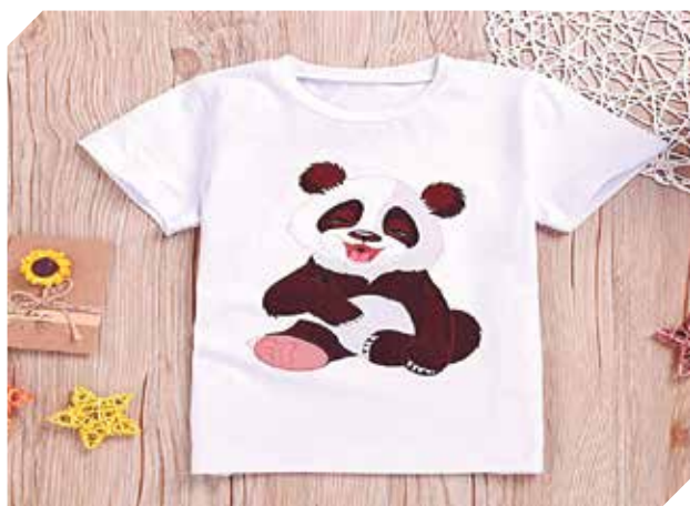
Remeras para lucir el mejor diseño y calidad.