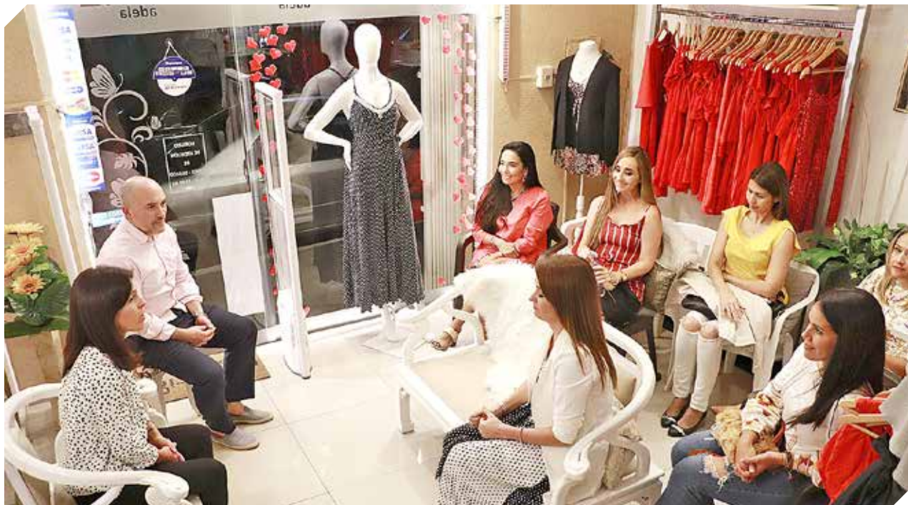
La charla expositiva trató temas como la voz, la seguridad en la imagen y la vestimenta de las mujeres.