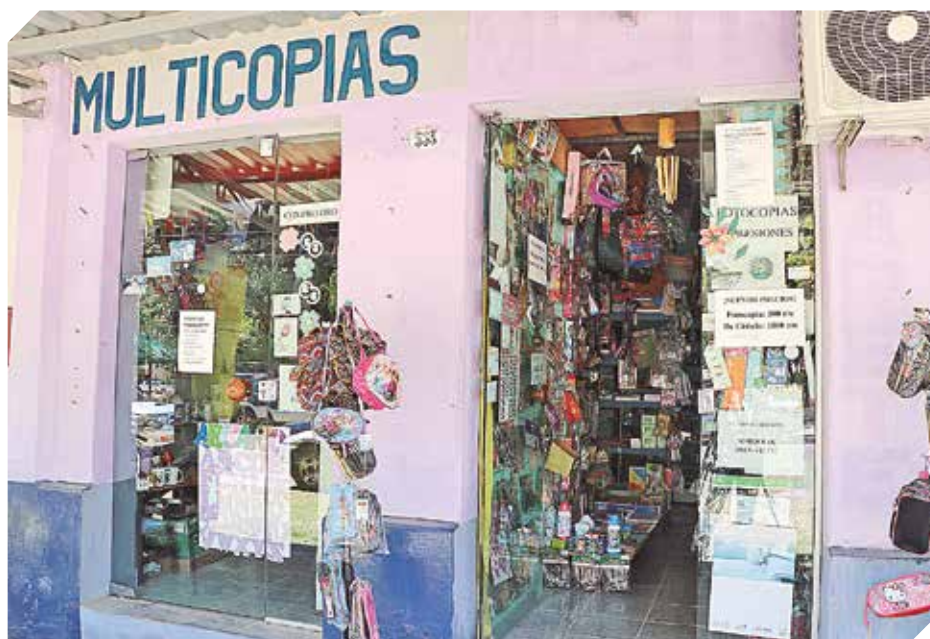
La librería se ubica al lado de la Municipalidad de Arroyos y Esteros.

"Si solo analizamos los aspectos negativos, nunca saldremos adelante en nada que nos propongamos"