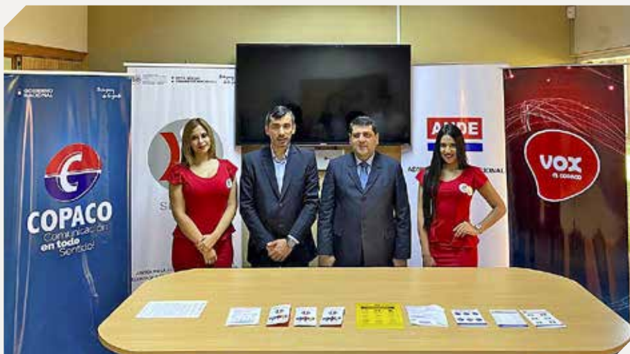
Instituciones públicas se unen a la Sedeco para crear conciencia.