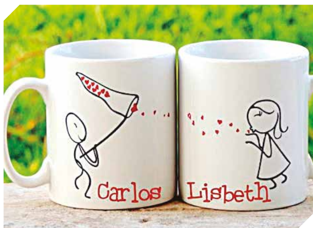
Tazas personalizadas para cumpleaños o eventos.