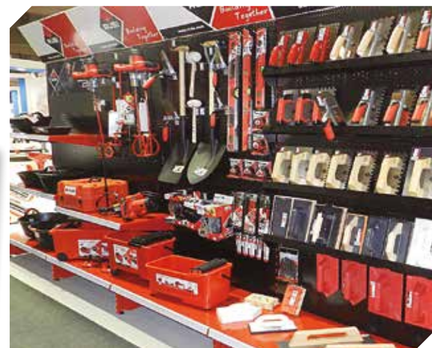
El local es atendido por sus propios dueños.

Artículos de la mejor calidad con precios mayoristas para todos los visitantes de La Preferida.