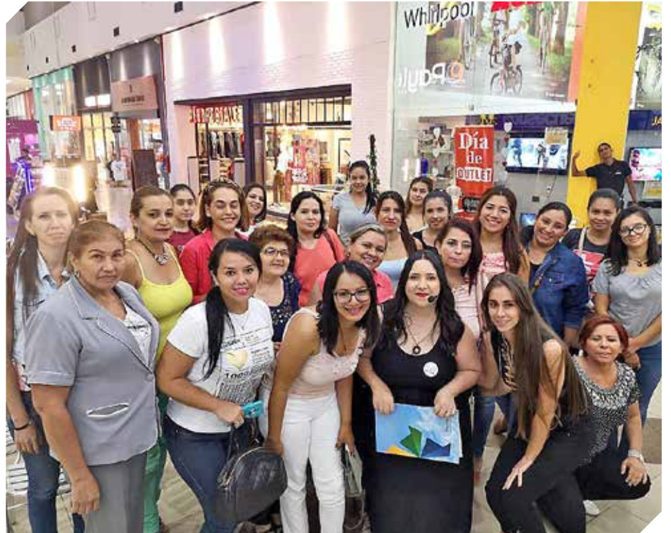
La Red de Mujeres Empresarias del Paraguay trabaja en conjunto con el Ministerio de Industria y Comercio.

“A nivel local el crecimiento es gigantesco, ya que asumimos cargos de alto mando como ministerios”