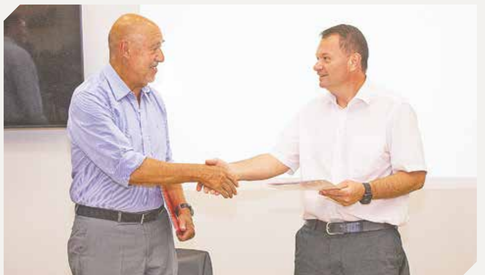
Representantes de ambas entidades reconocieron la importancia del compromiso.