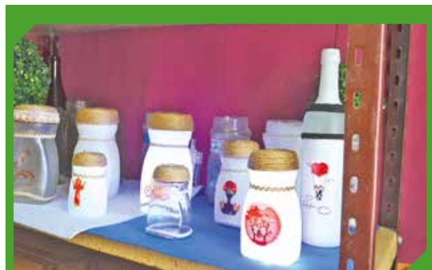
Veladores personalizados con precio excepcional.

La idea de emprender nace con el cumpleaños y el bautismo de su pequeño hijo, que fue el impulso principal que los llevó a alcanzar sus metas laborales.