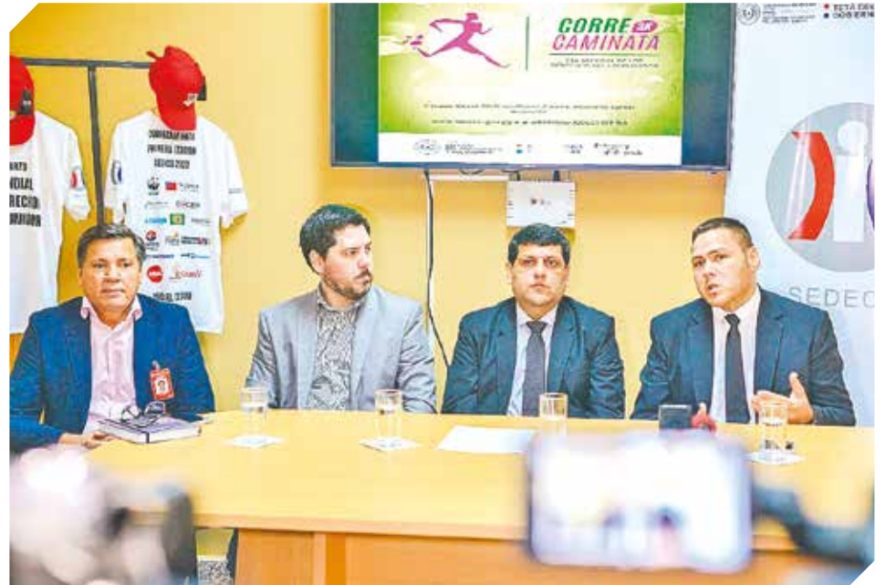
Durante el lanzamiento, las autoridades hablaron de lo que será el evento.

D urante la jornada se buscará promover la difusión de los derechos fundamentales que asisten a consumidores y usuarios. La misma tendrá lugar el domingo 15 de marzo desde las 08:00 hs. en el Parque Guasu Metropolitano.