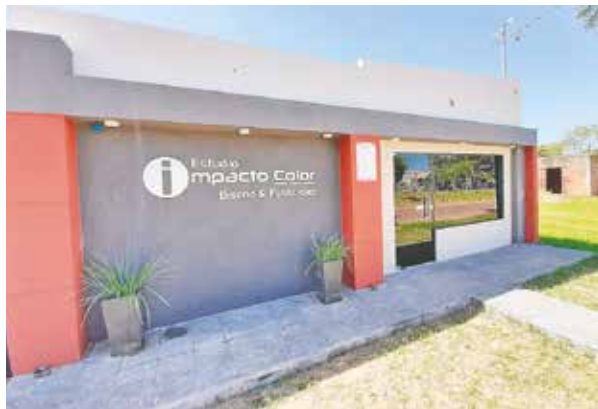
El negocio cuenta con promociones y descuentos.

El local atiende los días lunes a viernes, de 08:00 a 18:00 hs., y los sábados de 08:00 a 12:00 hs. Se ubica en calle Asunción c/Mcal López, a 30 metros del Super 6. Para más detalles, llamar al (0983) 157-499.