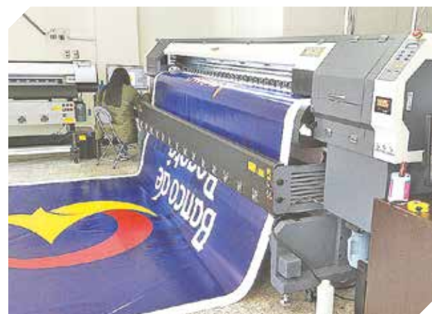
Impresión de banner para toda clase de negocio o local.