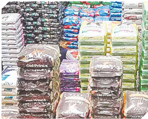
Arroz, fideos, azúcar, aceite, café son sus propuestas.

Artículos de calidad garantizada para el hogar se encuentran disponibles en San Antonio.