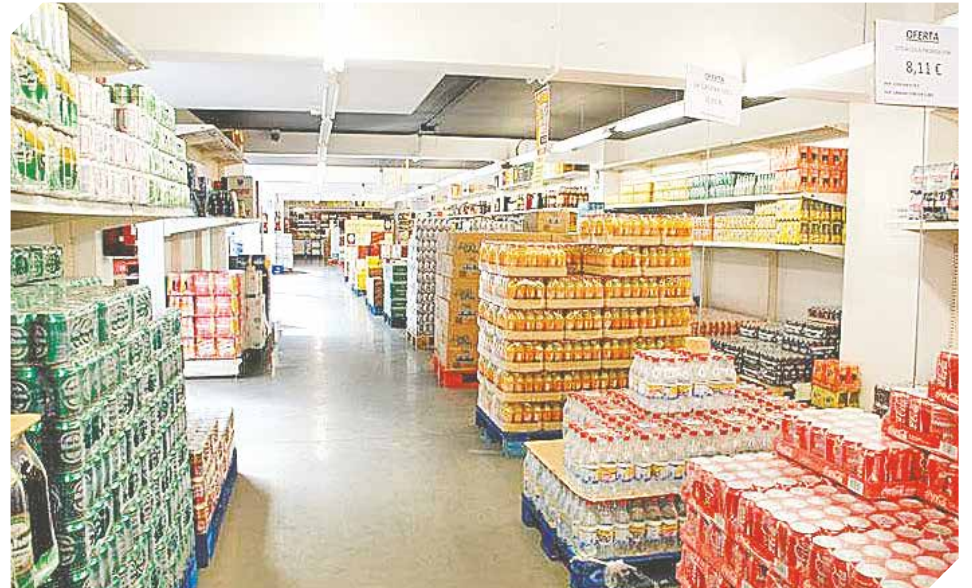
Un amplio local donde se cuenta con productos para la venta a mayoristas.

Además de distribuir todo tipo de marca de cervezas heladas, listas para disfrutar, en su local se encuentran todos los productos y alimentos de primera necesidad para el hogar. Algunas de sus mayores demandas son los panificados, arroz, azúcar, fideos, harina, aceites,