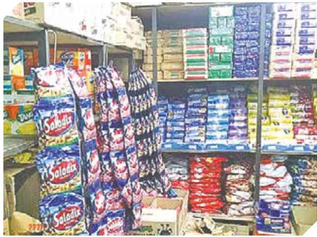
Los mejores productos para el hogar en un solo lugar.

Artículos de calidad garantizada para el hogar se encuentran disponibles en San Antonio.