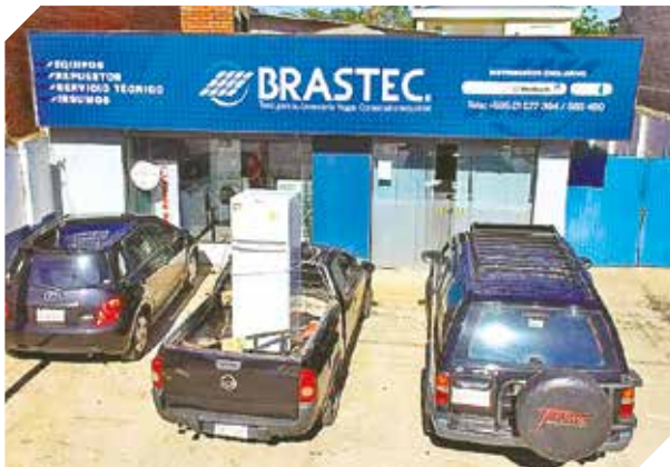
Brastec cuenta con 25 años de experiencia.