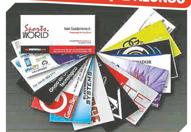
Tarjetas personalizadas con diseños de altos calidad.