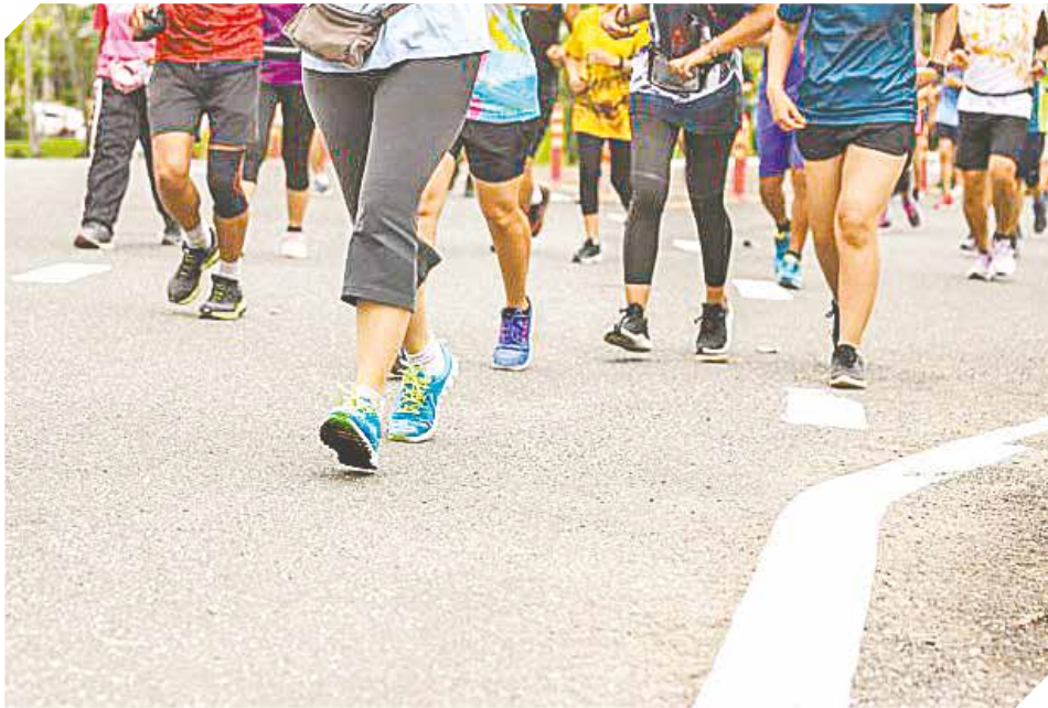
Los participantes recibirán medallas y accederán a sorteos de interesantes premios.

En recordación del Día Mundial de los Derechos del Consumidor, la Secretaría de Defensa del Consumidor y Usuario (Sedeco) lanzó oficialmente la Correcaminata 3K.