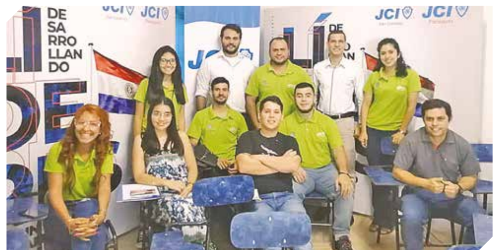
Buscan transformar a jóvenes en protagonistas positivos de sus comunidades.

ENVIA TU CV a: coordinacion@genteproactiva.com.py REF: EJECUTIVOS COMERCIALES o llámanos al 0982 186969