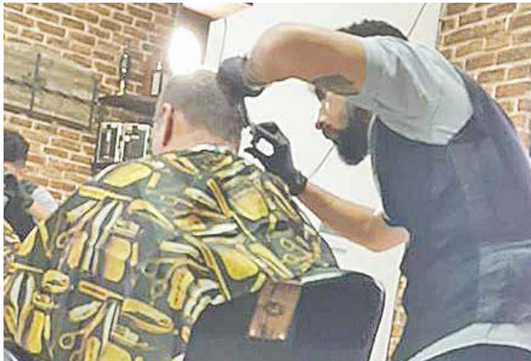
El emprendimiento lanzó promociones en febrero.

La dirección del emprendimiento es Comendador Nicolas Bo y Guaraníes, en la esquina de Canal 13. Para mayores datos, contactarse al (0992) 623-503.