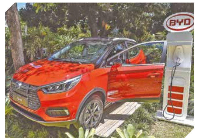
Cuenta con un diseño sofisticado y moderno.