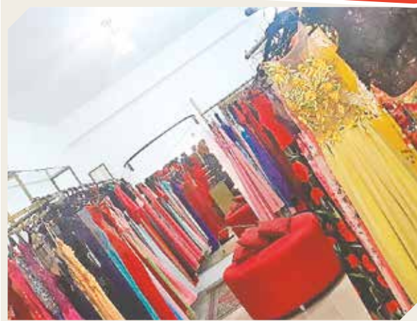
Las prendas son confeccionadas por el atelier.