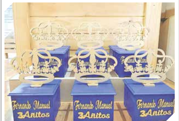
El emprendimiento dispone de precios mayoristas.

Abre sus puertas de 08:00 a 18:00 hs. de lunes a viernes, y sábados de 08:00 a 13:00 hs. El local se ubica en Avda. Zavalala Cue 1212 Esq. San José. Para más detalles, llamar al (0994) 272-347.