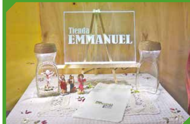
El local confecciona sus propios accesorios.