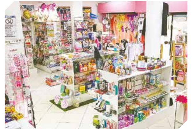
La librería abre de 07:45 a 20:00, de lunes a sábado.

Lodevero atiende de lunes a sábado, de 07:45 a 20:00, y se ubica sobre Nanawa c/ Curva Romero, en Luque. Para pedidos: (0976) 171-910.