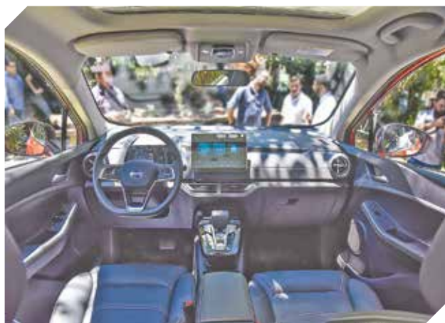
Presenta un interior cómodo y a la vez tecnológico.

“Seguiremos haciendo el máximo esfuerzo para que ese transitar que todos queremos de dañar menos al ambiente y contaminar menos con vehículos que sean rentables puedan tener acceso al mercado paraguayo.”