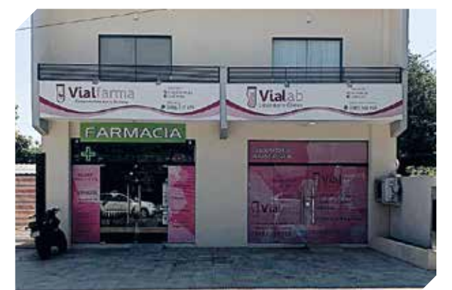
La atención de calidad está garantizada.

Atienden de lunes a viernes, en el horario de 06:00 a 19:00, mientras que los domingos abren de 08:00 a 14:00. Se ubica en Gral. Díaz c/ Gaspar Rodríguez de Francia. Para más información, llamar al 0986 108-686.