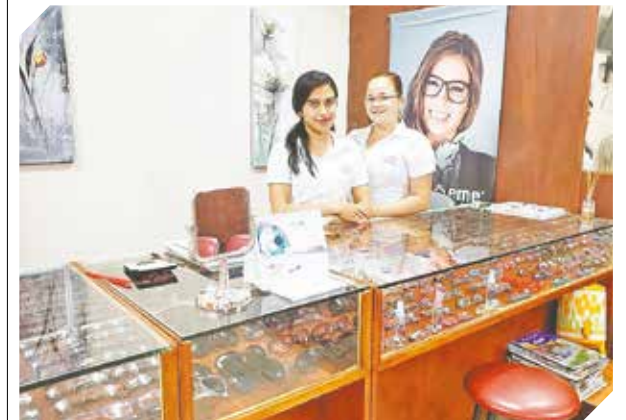
La óptica dispone de armazones de alta calidad.

Para obtener más detalles, comunicarse al teléfono (0981) 247-496.