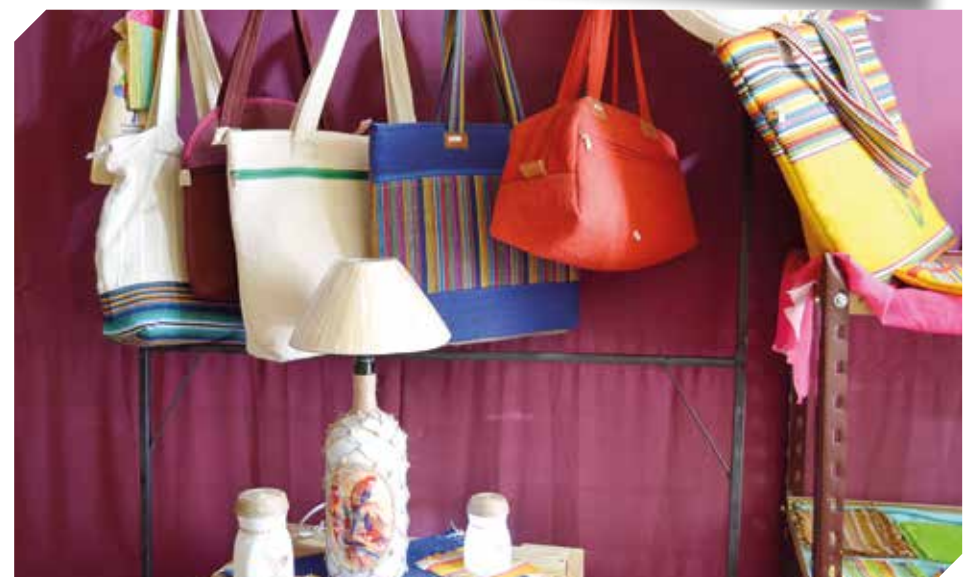
Entre sus variados productos también se encuentran carteras artesanales.