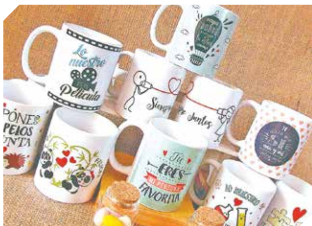
Tazas personalizadas para fechas especiales.

CONTACTO Y DIRECCIÓN ● Ubicación: San José Sur, en el barrio Isla Aranda ● Contacto: 0981 687-179