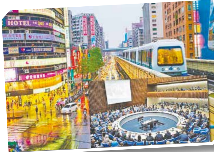
Taiwán quiere formar parte de la OMS para contribuir en la lucha contra el coronavirus.

El grupo de legisladores expresó que la insistencia de la OMS en tratar a Taiwán como parte de China continental ha afectado los derechos de nacionales taiwaneses, por llevar a ciertos países a imponer restricciones de entrada a ellos y la suspensión de vuelos a Taiwán. Además,