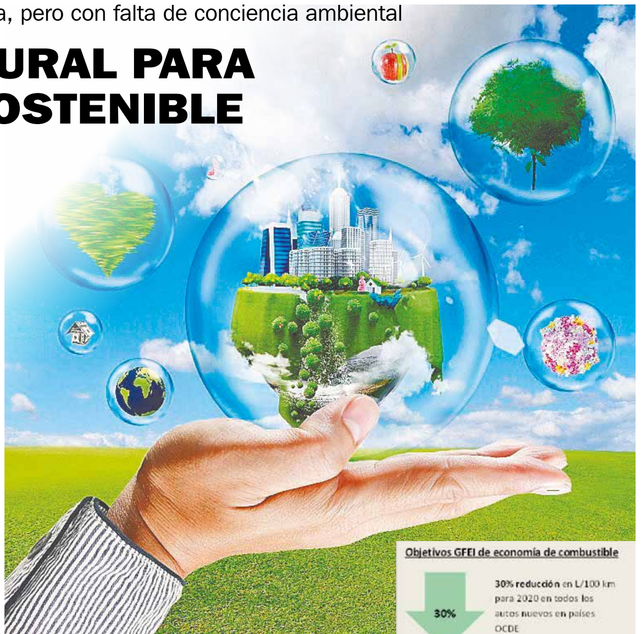
Objetivos GFEI de economía de combustible

Recomiendan la implementación de una política nacional de eficiencia energética y el control de las emisiones, y apuntan a la modernización del parque automotor y la incorporación de tecnologías amigables con el medio ambiente.