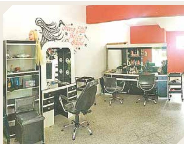
El local ofrece todo tipo de servicios estéticos.