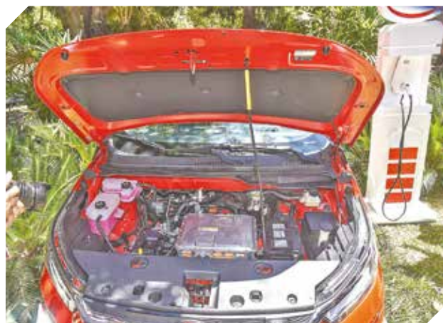
Posee un motor eléctrico y batería de larga duración.