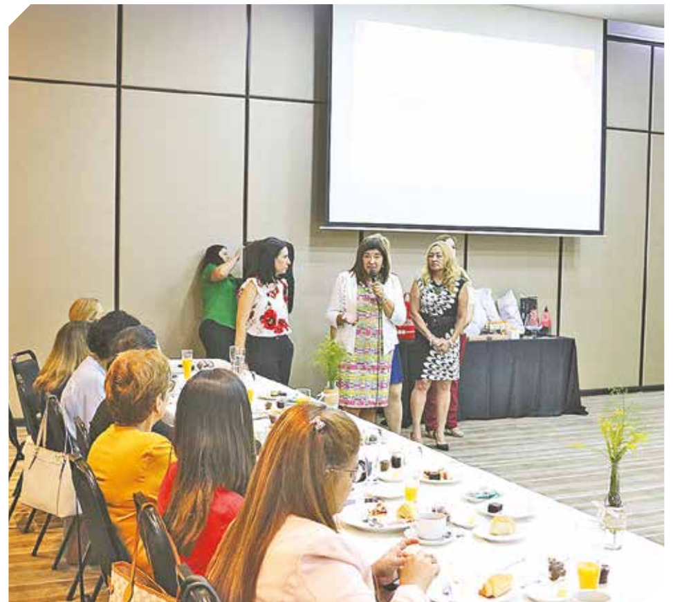
Autoridades de la Asociación compartieron los nuevos proyectos para el año.

“Nuestro principal objetivo buscar el empoderamiento y para ello brindamos herramientas”.