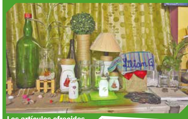
Los artículos ofrecidos están hechos con materiales reciclados.

“Nuestro hijo fue nuestro principal motor para iniciar este camino del emprendedurismo con muchas fe”.