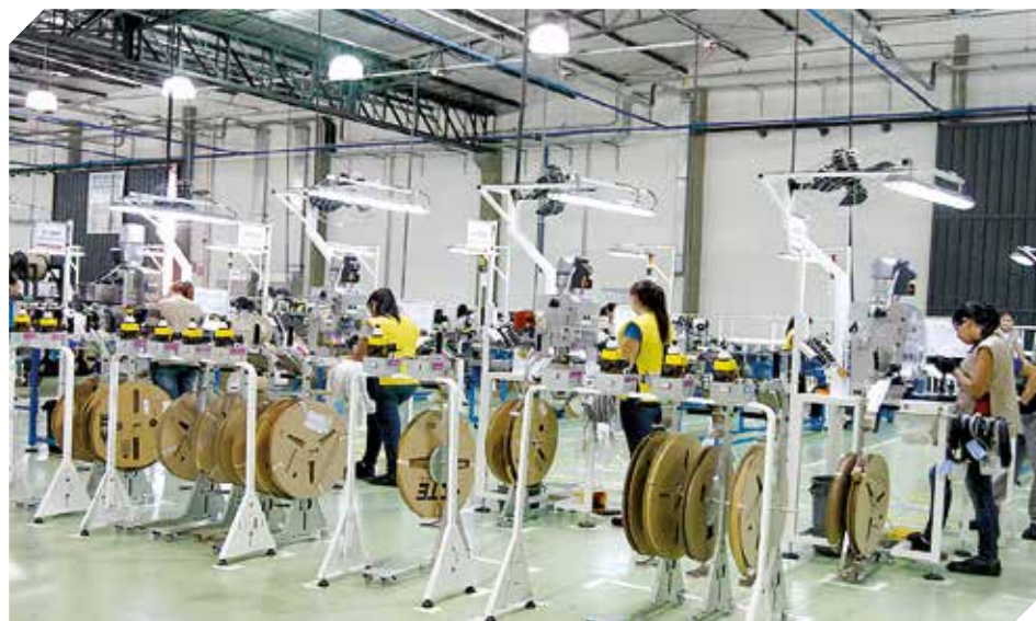
El objetivo es integrar a pymes a la cadena de industrias exportadoras.

Para fortalecer a las pymes, el MIC logró la cooperación de técnicos coreanos que se encargaran de preparar a las pequeñas y medianas empresas paraguayas de este segmento. El objetivo es que también formen parte de la cadena que actualmente envían las piezas a las industrias automotrices de la región.