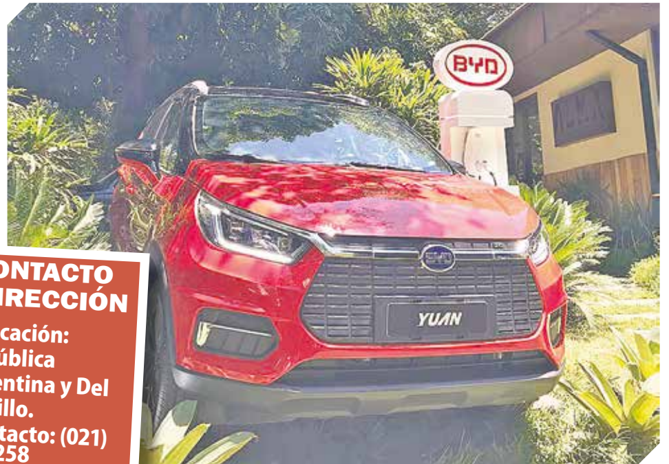
El futuro del automovilismo ya está presente en el país.