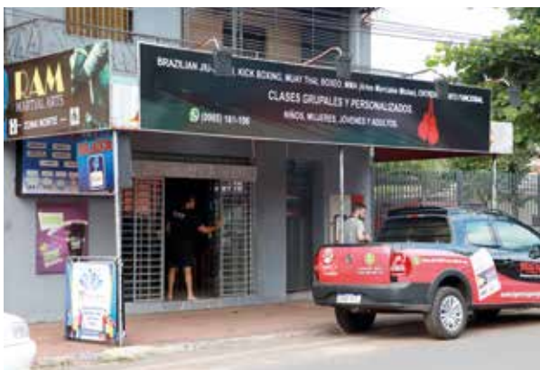
RAM imparte cursos de defensa dirigidos a mujeres.

La dirección de la academia es 10 de Julio y Las Residentas, de la ciudad de Fernando de la Mora. El horario de atención es de 07:00 a 21:00, de lunes a viernes; los sábados abren sus puertas entre las 09:00 y 12:00. Teléfono: (0985) 161-106.