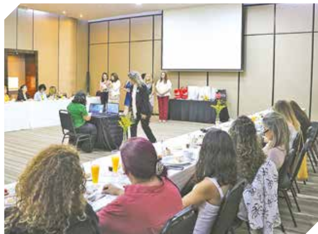
Socias de APEP, compartiendo un ameno encuentro.