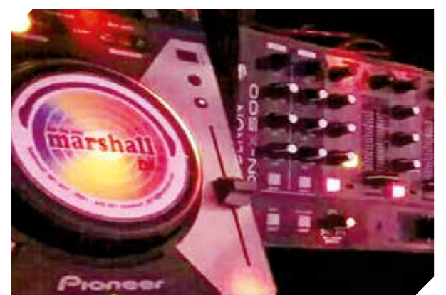
Marshall DJ tendrá promociones y descuentos.

Los servicios de Marshall DJ pueden ser brindados en todo tipo de eventos públicos y privados. La animación de fiestas por parte del emprendimiento cuenta con efectos de fuegos artificiales, luces led y pantallas. Para mayores detalles, comunicarse al teléfono (0981) 458-891.