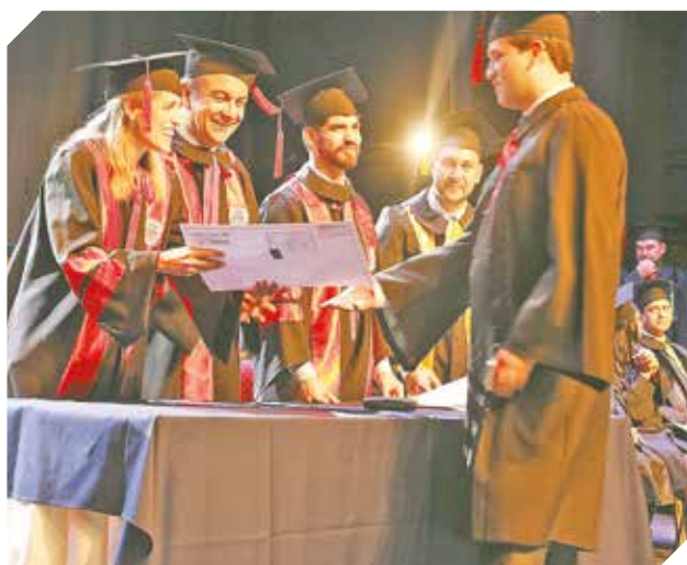
Los estudiantes recibieron con honores sus títulos.