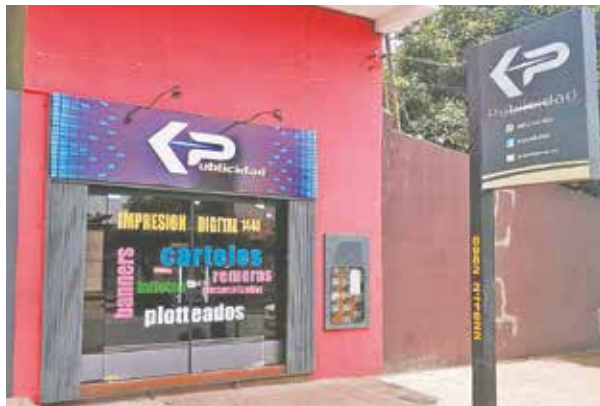
Empresa familiar con más de 20 años de experiencia.

Con más de 20 años de experiencia en el rubro, busca innovar y ofrecer servicios de calidad a todos sus clientes. Presupuestos y consultas al (0982) 241-822. Facebook:kppublicidad1 Instagram:@kppublicidad.