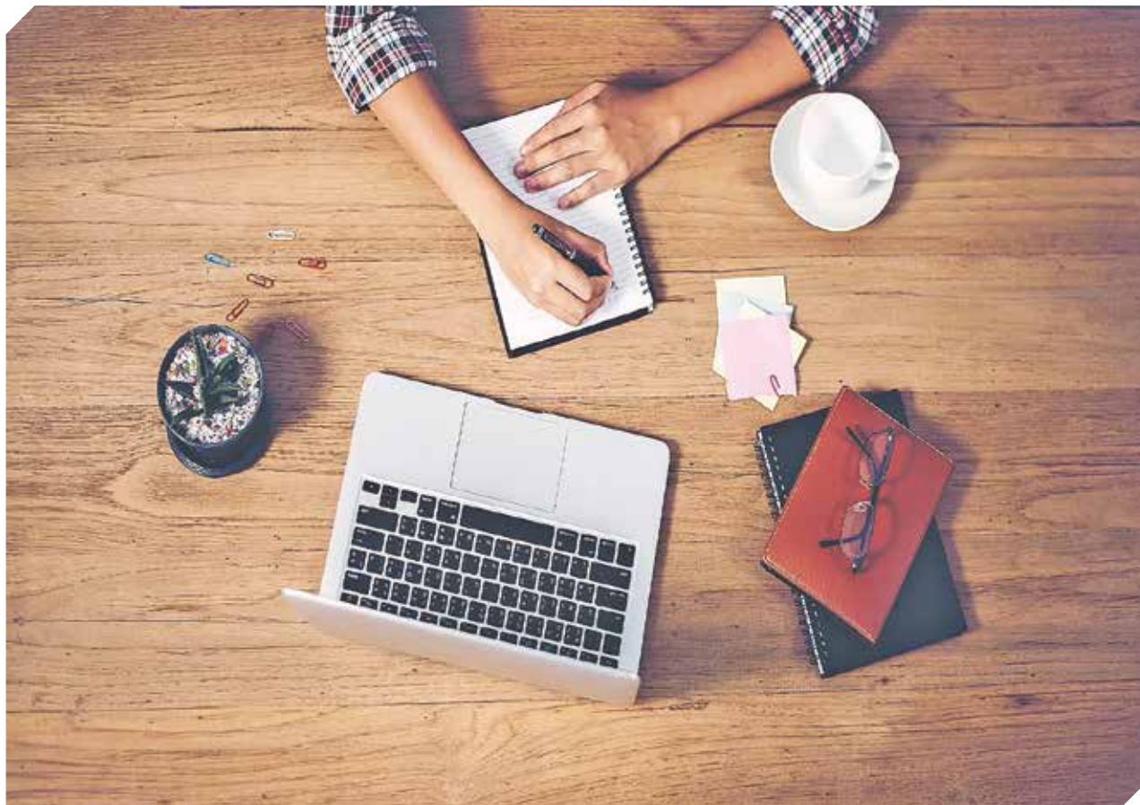
Estudiar las condiciones del mercado y como se está posicionado en el, es fundamental para el éxito en todas las ventas.

Hay muchos factores de éxito comunes en la gran mayoría de procesos de ventas. La aplicación regular de estos principios garantiza destacar sobre el resto de los vendedores y permitirá alcanzar las metas profesionales, y desarrollar una actitud positiva.