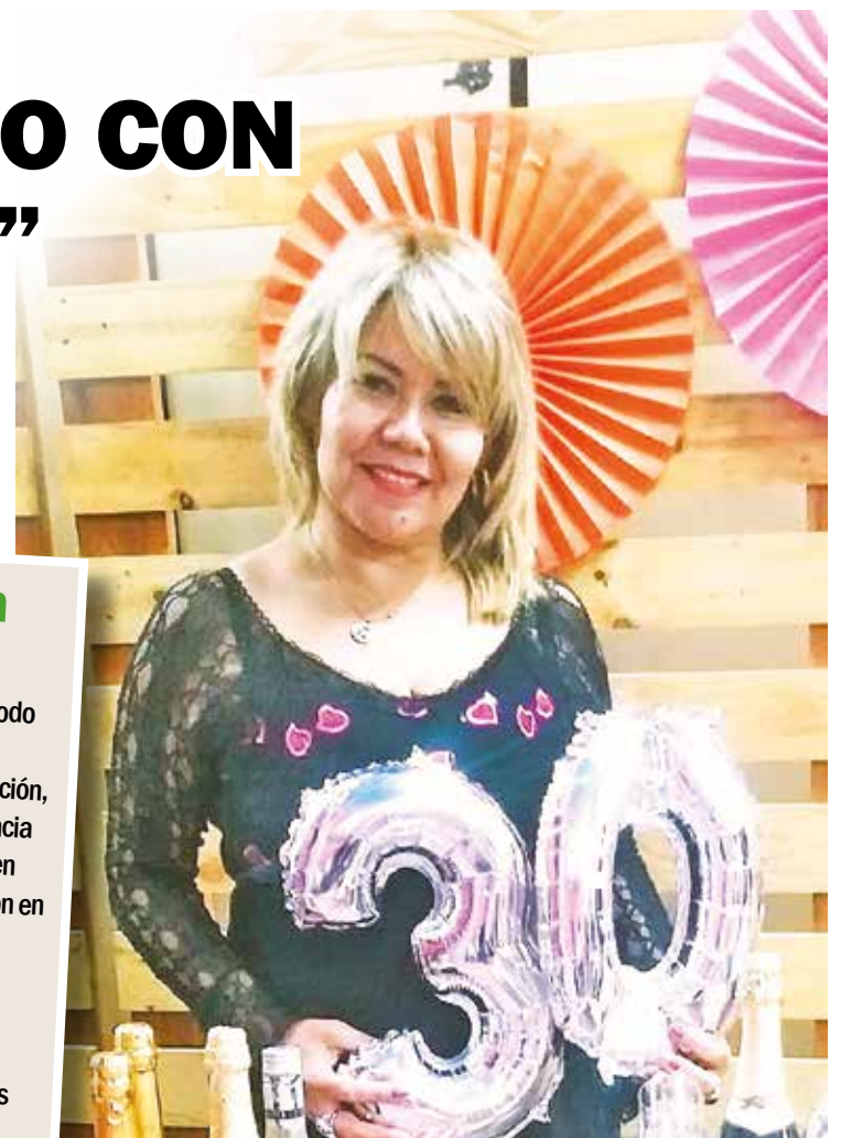
La emprendedora lleva 30 años en el rubro de la estética y la belleza ofreciendo atención de calidad.

“Mi padre no apoyaba mi decisión, era sinónimo de pobreza. Soñaba con ser peluquera, toda profesión es hermosa, elijas lo que elijas”.