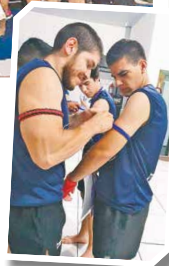
Entrega de brazalete y ascenso de grado.

Para más información comunicarse al teléfono (0994) 537-563.