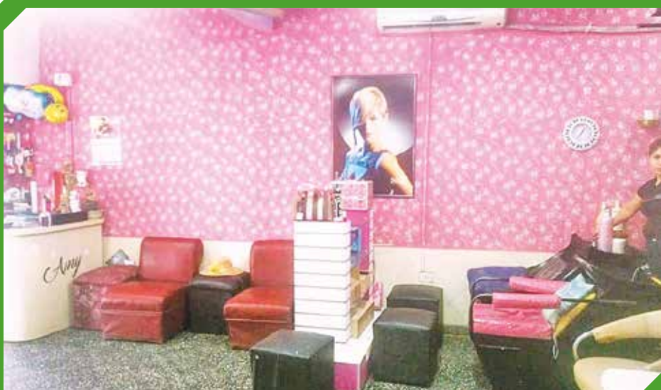
Salón preparado para la atención y comodidad de los clientes.