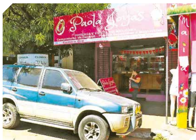
Un cómodo lugar donde realizar tus compras.

También desde las redes sociales para alcanzar a más personas y brindar todo lo solicitado por toda su clientela. Ante esto es importante que encuentren proveedores que ofrezcan productos y artículos variados tanto en calidad y buen precio, para obtener buenas ganancias.