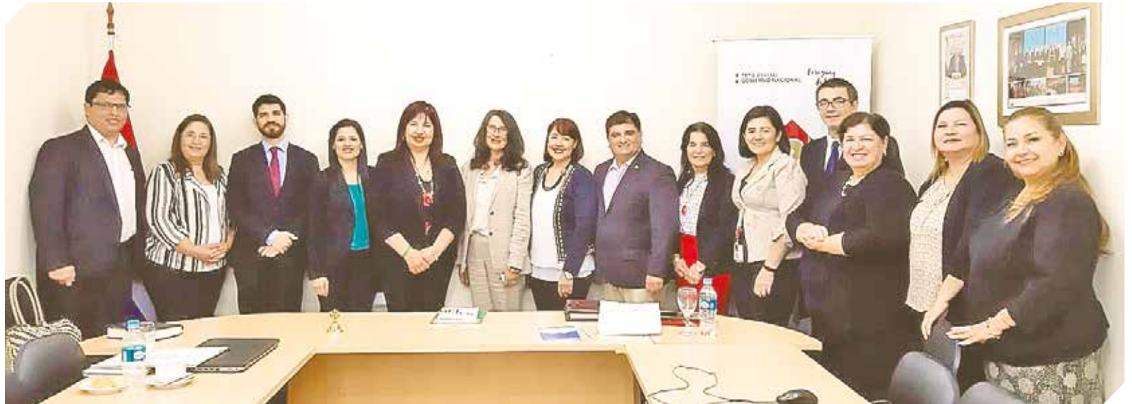
Equipo de universidades nacionales que comparten el desarrollo dentro del programa Consens para generar avances en la educación.

“Este es un paso importante dentro del en-