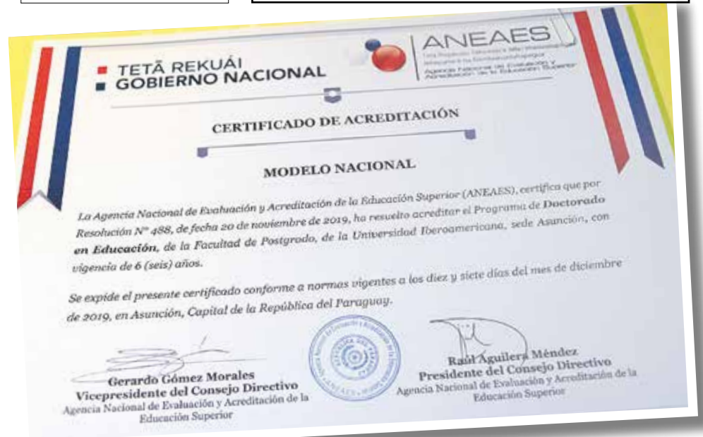
Documento oficial que avala la acreditación de los programas de Posgrado por la Aneaes.