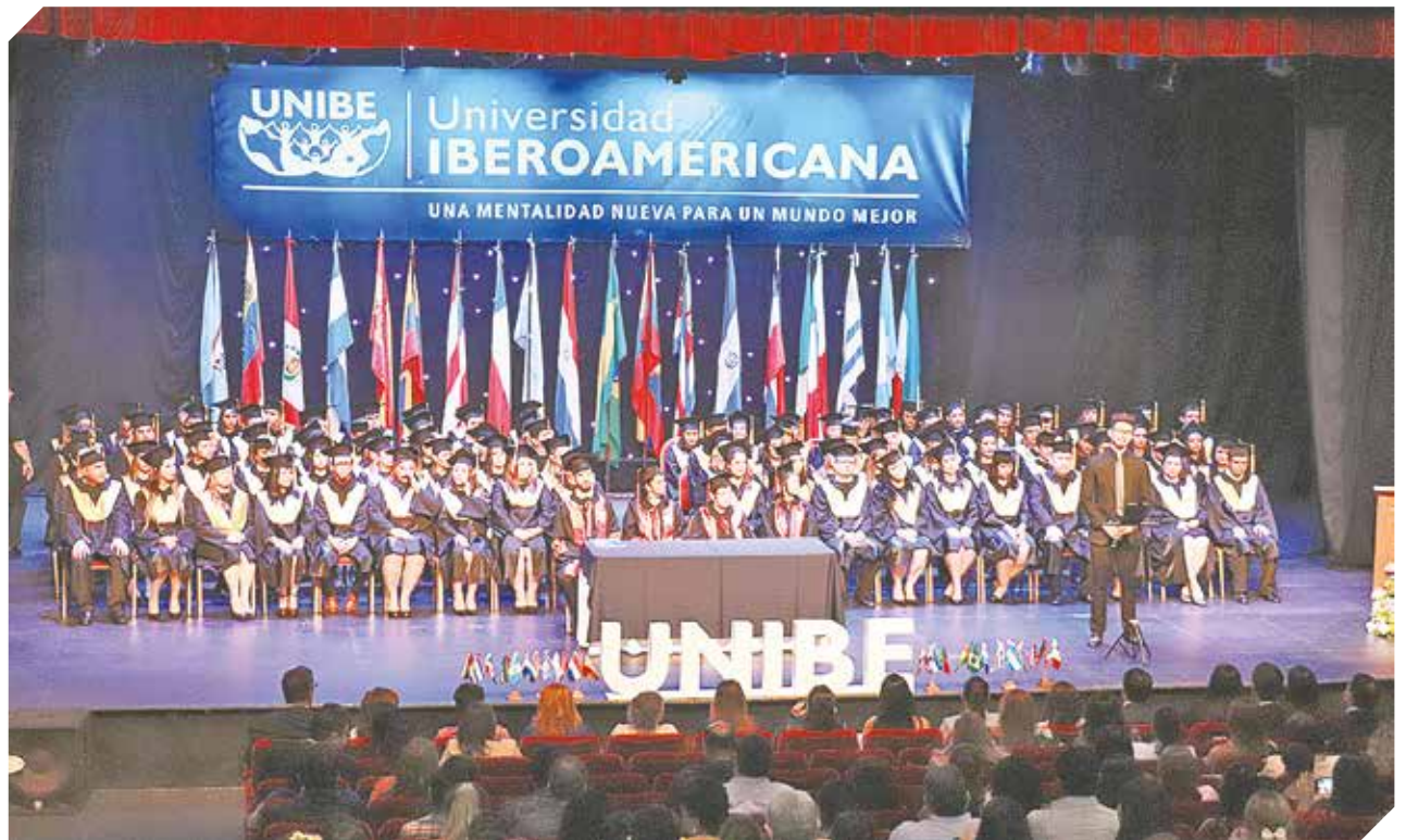
El acto de graduación tuvo lugar en el Teatro del Hotel Guaraní en compañía de familiares y allegados.

El Teatro del Hotel Guaraní fue el punto del encuentro.