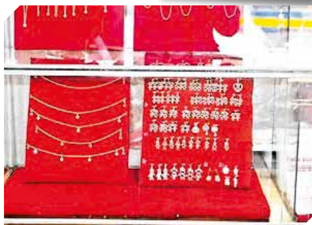
Los mejores precios para todos los mayoristas.