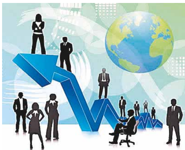
2020 será un año de grandes avances para el sector.

Sin embargo, existe un fuerte pedido de las pequeñas, medianas y grandes empresas, en el acceso a la información, créditos y asesoramiento. Referentes manifiestan que si bien existen avances, aún