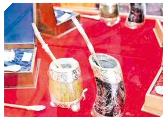
Todos los trabajos llevan el sello de garantía del local.