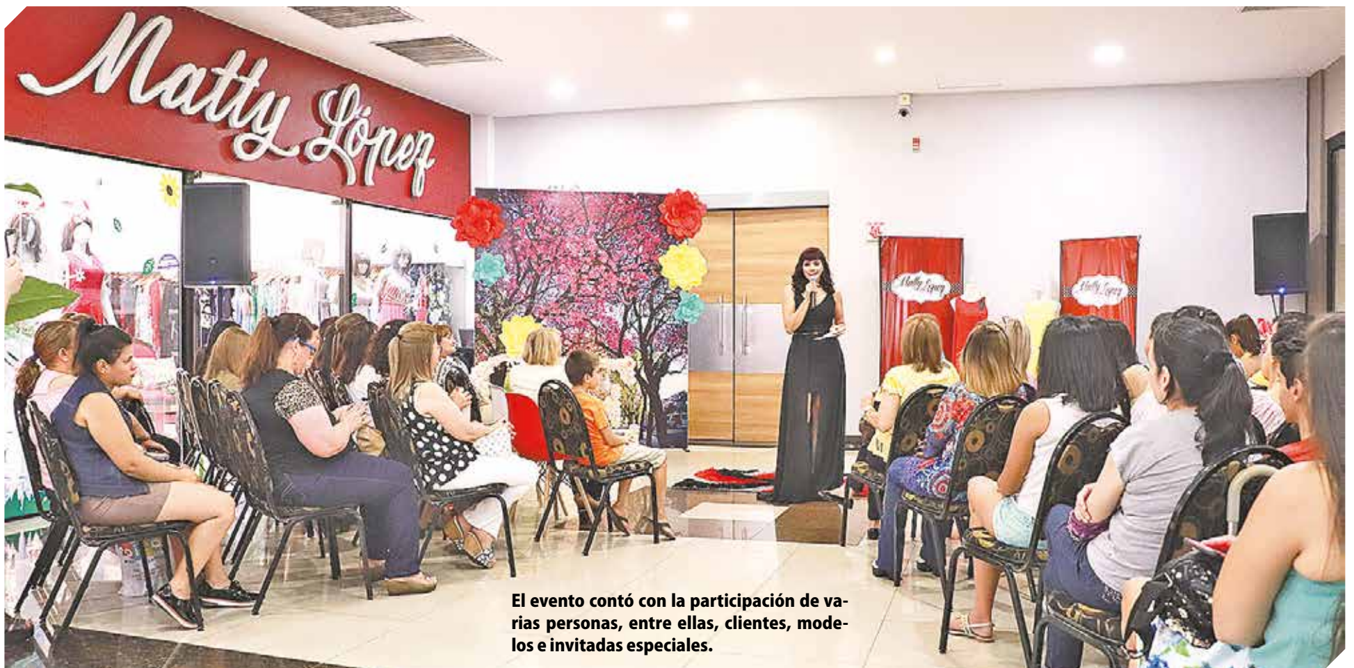
El evento contó con la participación de varias personas, entre ellas, clientes, modelos e invitadas especiales.