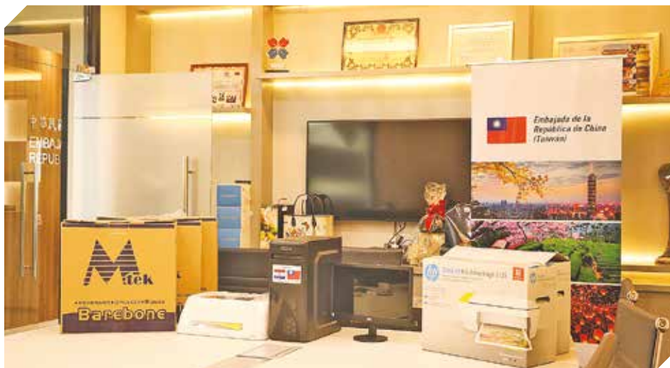
Los equipos informáticos serán destinados a mejorar el tiempo de atención.