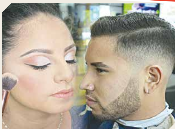
Amplios servicios para damas y caballeros exigentes.