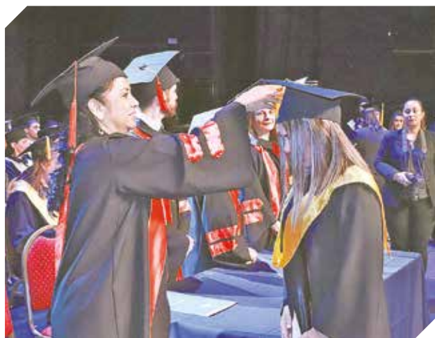
Simbólica bienvenida a los profesionales egresados.

“La Unibe apuesta por una educación de calidad, por ello se sometió a los procesos de evaluación y acreditación por parte de la Aneaes...”