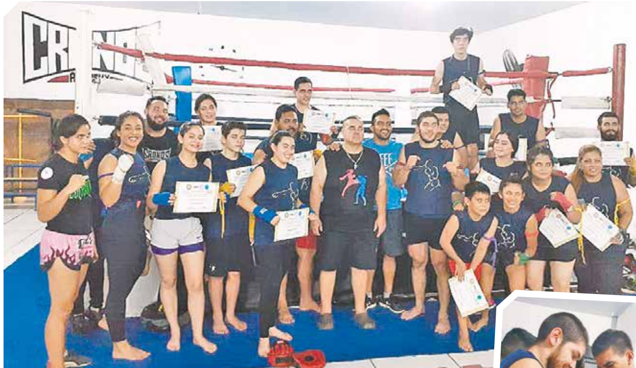
Los estudiantes de Cronos Academy luego de recibir sus respectivos reconocimientos.

Como todo ejercicio físico debe ir acompañado de una buena dieta y