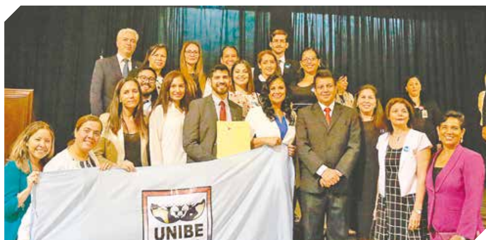
Es la 1ª universidad privada con mayor número de posgrados con acreditación de calidad.