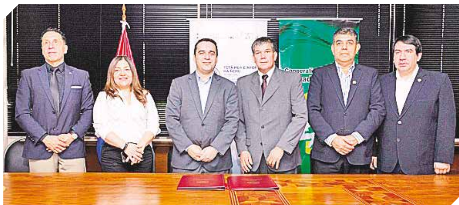
Autoridades nacionales y cooperativas durante la firma del acuerdo.