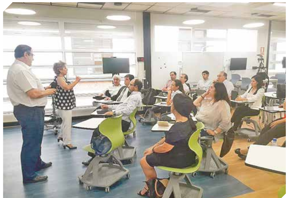
Viaje de los representantes nacionales al continente europeo para capacitación.