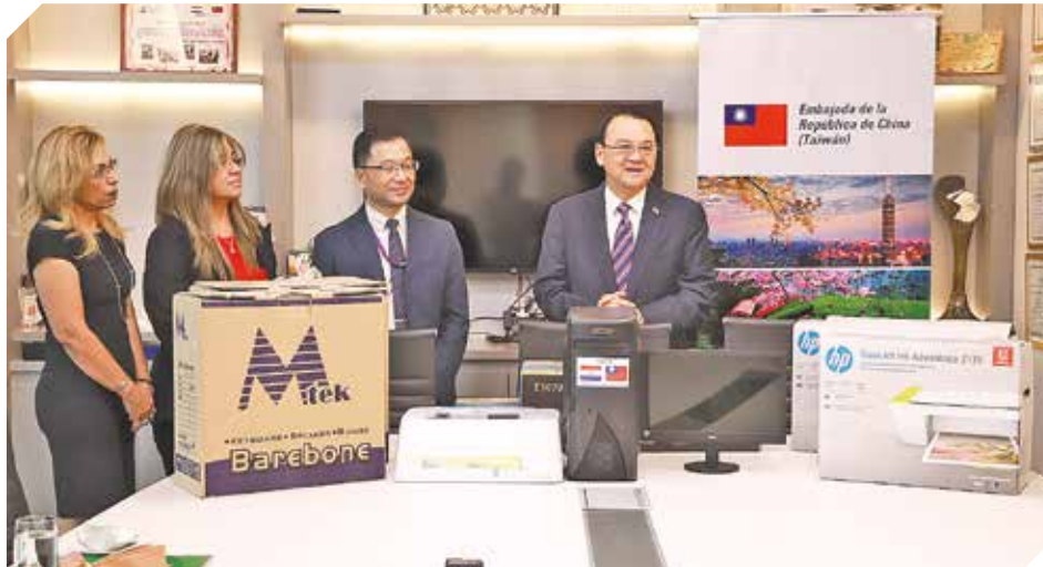
La entrega se realizó en la sede de la embajada taiwanesa en Asunción.

El INN se encuentra sobre Cptán. Lombardo, a media cuadra de Santísimo Sacramento. Atiende de lunes a viernes de 07:00 a 15:00.