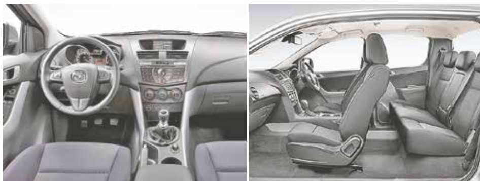
Interior espacioso además de contar con componentes de la más alta tecnología.

Las personas que tienen una BT 50 tienen la posibilidad de utilizar la carrocería para trasladar todas las comodidades necesarias como parrillas, camping, sillones y todo lo que se requiere para pasar un fin de semana en el campo.