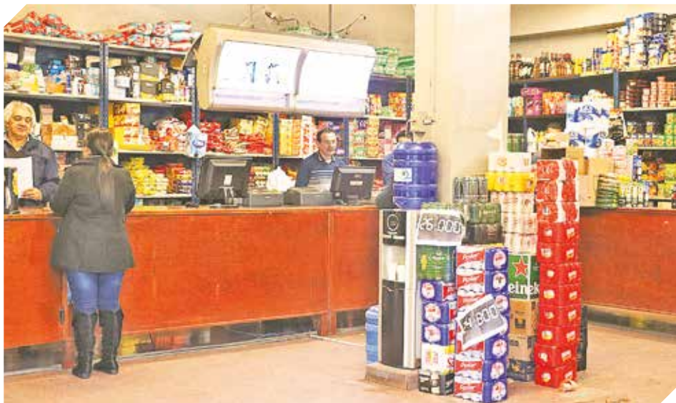
Todo lo necesario para el hogar, productos de primera calidad a precios especiales.

Sus años en el mercado son el sello de garantía para toda la comunidad. Su gran alcance es genera-