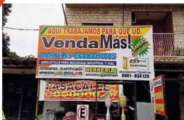
Todos tipo de servicios publicitarios a costos accesibles.

» Con el eslogan "Aquí trabajamos para que usted venda más" CAB P & H se especializa en la cartelería publicitaria para cambios de lona y mantenimientos.