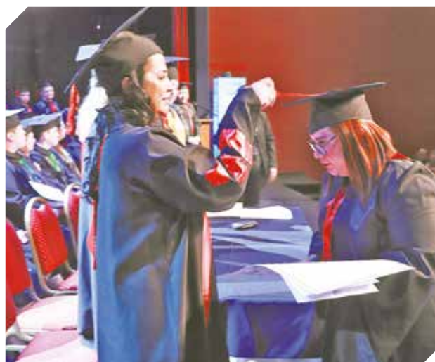
La rectora entregó la venia a cada nuevo profesional.