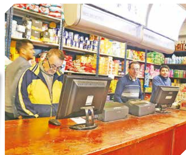
Todo lo mejor los 365 días del año en un solo lugar.

Todos los visitantes tienen la oportunidad de acceder a costos mayoristas y preferenciales.