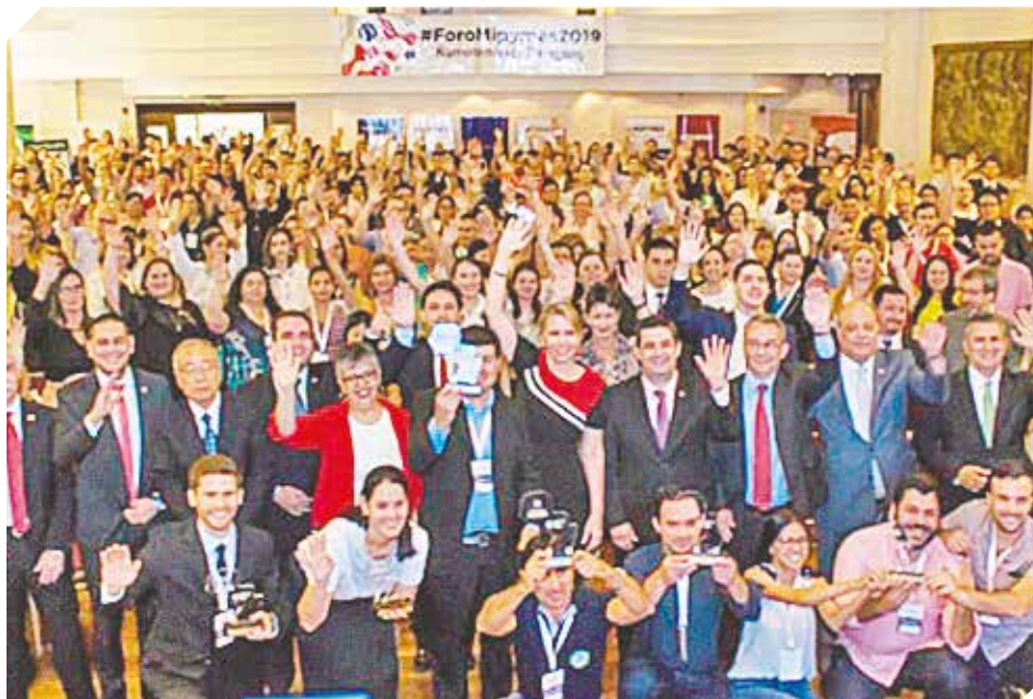
El 2019 estuvo marcado por eventos de fomento al sector emprendedor.

“La formalización es el desafío más grande, como un proceso de consolidación que beneficie a los empresarios”.