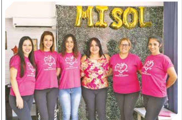
Invita a disfrutar de una pequeña pausa del día a día.

En estética se destacan los servicios de tratamientos reductores, anticelulitis, baños de luna, etc. Se ubica en 1ª Junta Municipal y Arq. Tomás Romero, Fndo. de la Mora. Contactos al (0991) 732-328.