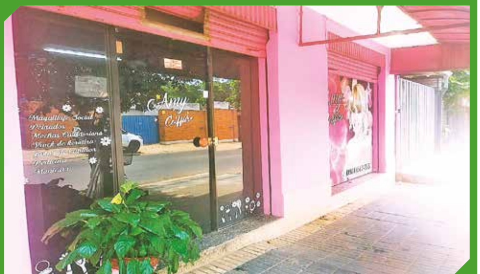
Maquillaje social, peinados, manicura y pedicura son sus servicios.