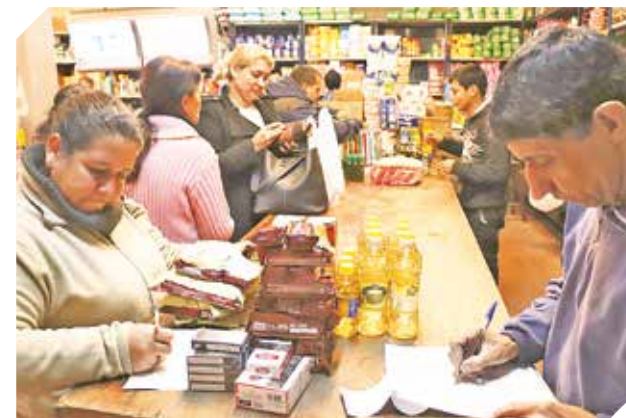
El local es atendido por sus propios dueños.

Todos los visitantes tienen la oportunidad de acceder a costos mayoristas y preferenciales.