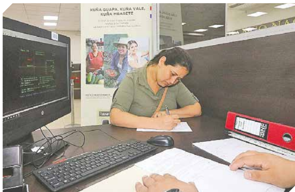
Cada vez son más las líneas de crédito del BNF dirigidas a los emprendedores.