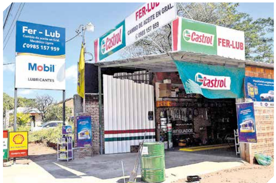
El local tiene todo lo necesario para brindar atención de calidad al cliente.

El local se encuentra entre las calles Nuestra Señora de la Asunción casi Ypacaraí y el número de contacto es el 0985 157-959.