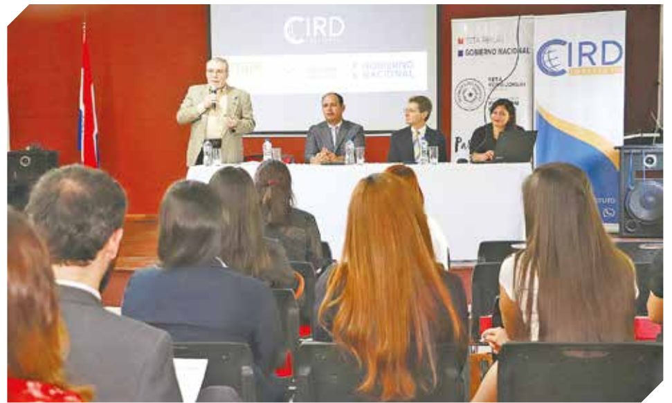
Autoridades del CIRD e INAPP presentaron interesantes nuevas carreras.

brindar seguridad electrónica, colocamos alarmas, cámaras, GPS, integración de sistemas y lo aprovechamos con los responsables acercarlos lo mejor a todos los usuarios en el día a día. Haciendo un breve