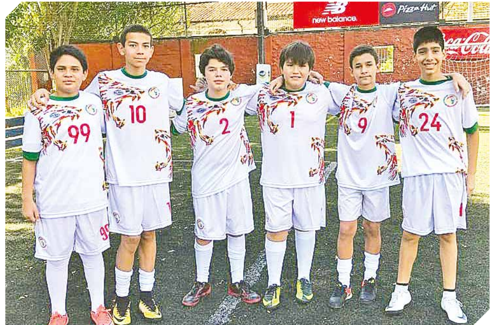
Disponible para vestir equipos completos en torneos de gran envergadura.

O visitar la fanpage en Facebook como Producción Adonai, para conocer más sobre la amplia variedad de productos y accesorios que tienen a la venta.