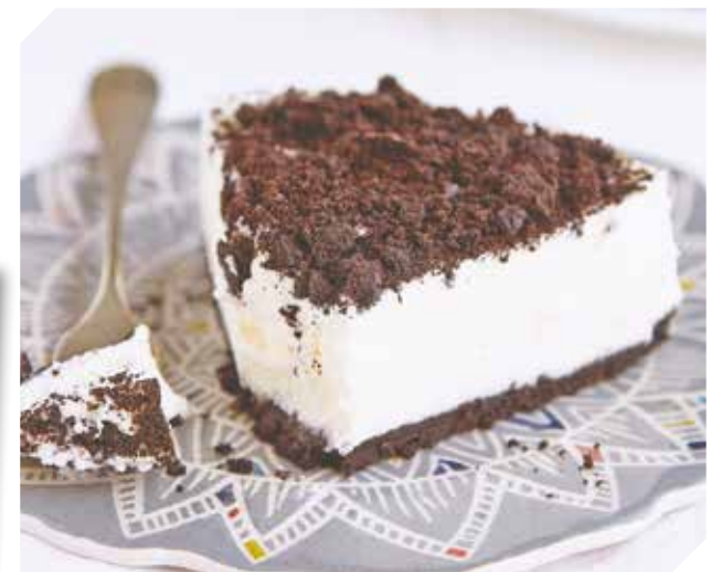
La empresa recibe todo tipo de pedidos a toda hora.

El buen sabor, la calidad, la utilización de productos de primer nivel son el sello de garantía.