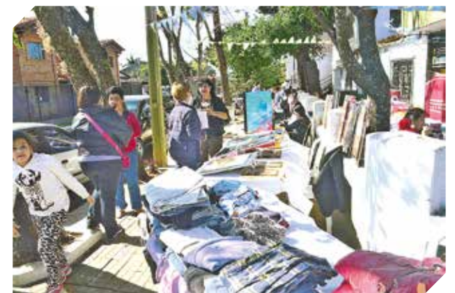
El sector se fortalece y busca nuevos mercados.