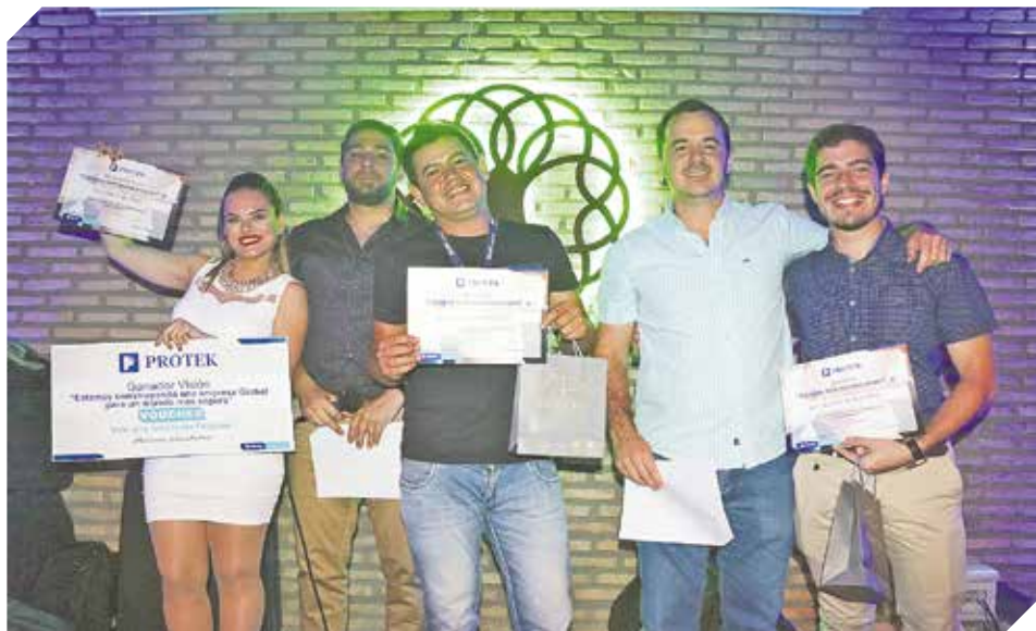
Todos los colaboradores obtuvieron importantes premios en la fiesta.

Ambas instituciones buscan brindar mayores oportunidades a toda la juventud.