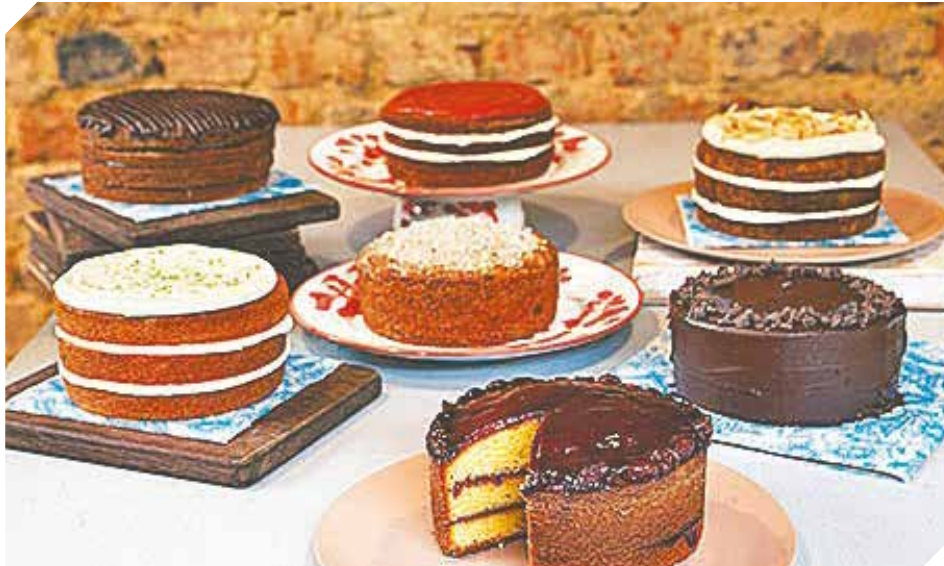
Los mejores productos para toda la familia se encuentra en un solo lugar.

Los productos que están a disposición de los mayoristas son los panificados, medialunas, masitas, pastafrolas, tortas, entre otros. Este negocio se caracteriza por su rentabilidad sujeta a importantes márgenes de ganancias que van desde el 15% al 25%. La cantidad y constancia de compra de los revendedores hacen