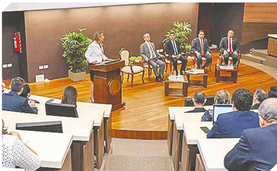
Presentación del informe de gestión de Liz Cramer, ministra del MIC.

va, en 10 departamentos del país. Además, se crearon 2.403 páginas web para las mipymes. Se impulsaron además el Primer Plan Estratégico de la Economía Creativa y la coordinación y desarrollo del Primer Mercado de Industrias Culturales y Creativas. Cramer destacó, finalmente, que el objetivo es impulsar, todavía más, el crecimiento de este sector, fundamental para la economía.