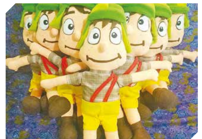
Todo tipo de peluches para cumpleaños y regalos.