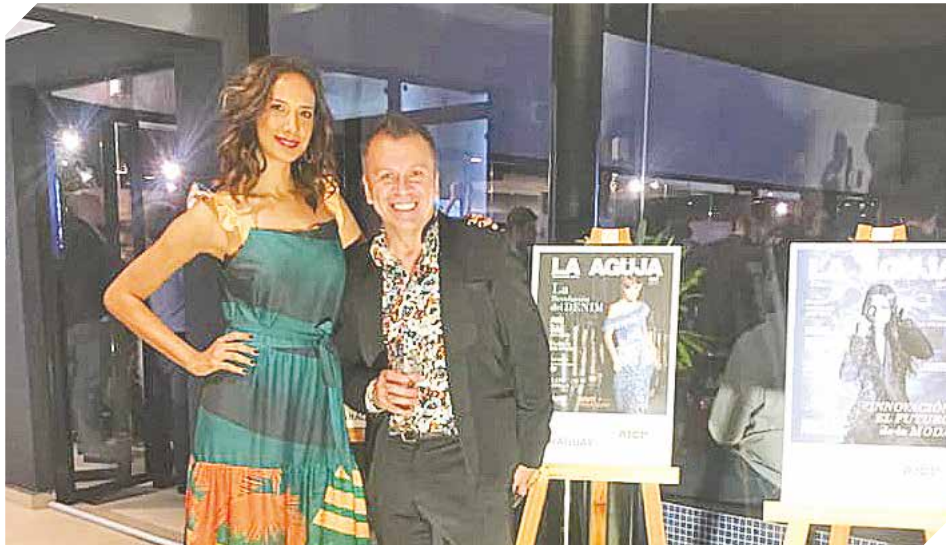
En la noche de gala varios diseñadores y confeccionistas recibieron premios.

Se premiaron categorías como el Visual Merchandising, donde la ganadora fue la empresa Martel. En la categoría Comunicación en Redes Sociales, donde se midió la calidad a nivel gráfico,