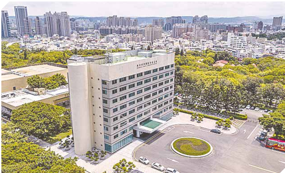
El edificio administrativo del Parque Científico de Hsinchu.

crear cadenas de valor, asociadas con poderosas multinacionales a través de la industria biotecnológica y farmacéutica, industria de maquinaria inteligente y de tecnología verde.