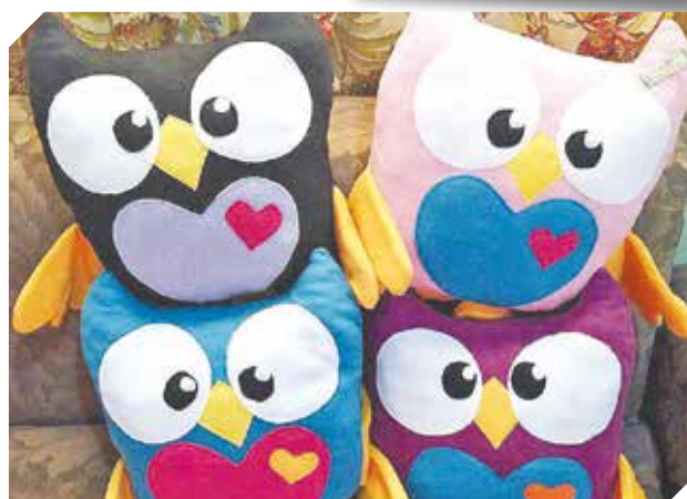
La buena calidad es el sello de garantía para todos.