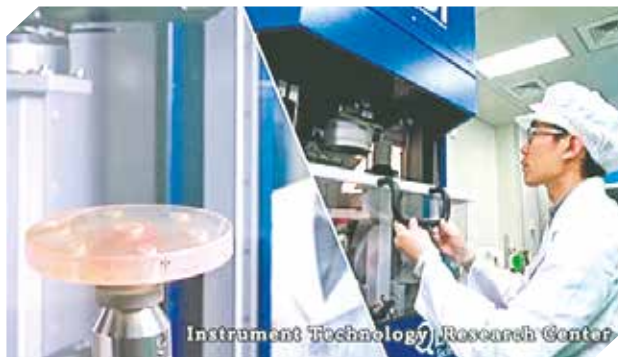
Instrument Technology Research Center