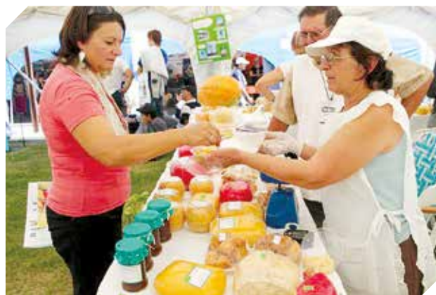
Pequeños empresarios buscan mayores oportunidades.

Otro de los grandes avances, está relacionado a la innovación y tecnología. Gracias a un proyecto elaborado por el Vicemi-