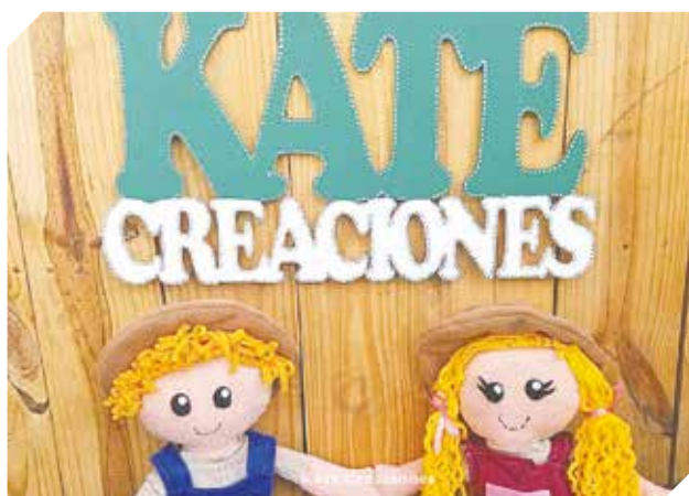
Variados productos para todo tipo de acontecimientos.

Se encuentran ubicados en la ciudad de Yaguarón, en Ruta I, Km 47. Contactos al (0981) 887-618.