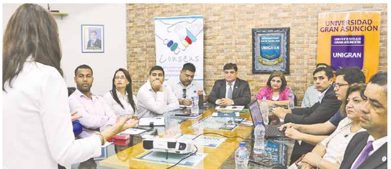
Reunión. Charla sobre la implementación de Créditos Universitarios para la movilidad internacional.

Nos interesa tu opinión. Escríbinos a: lectores@gentedeprensa.com.py