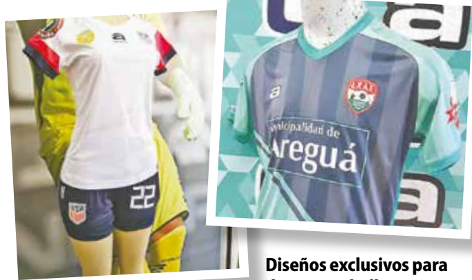
Diseños exclusivos para damas y caballeros.

Confección de grandes pedidos de indumentarias para torneos de exalumnos y cualquier tipo de actividades deportivas.