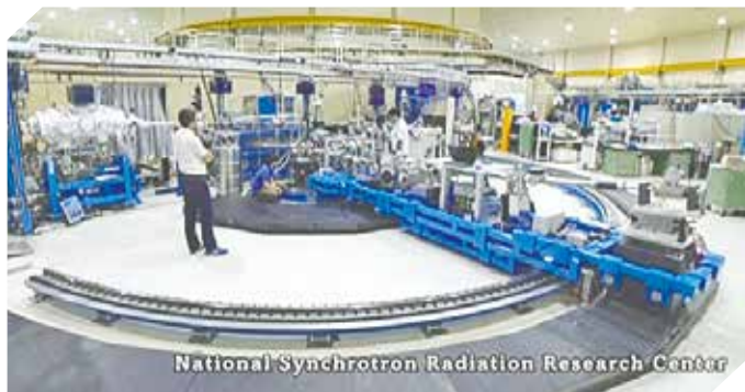
National Synchrotron Radiation Research Center