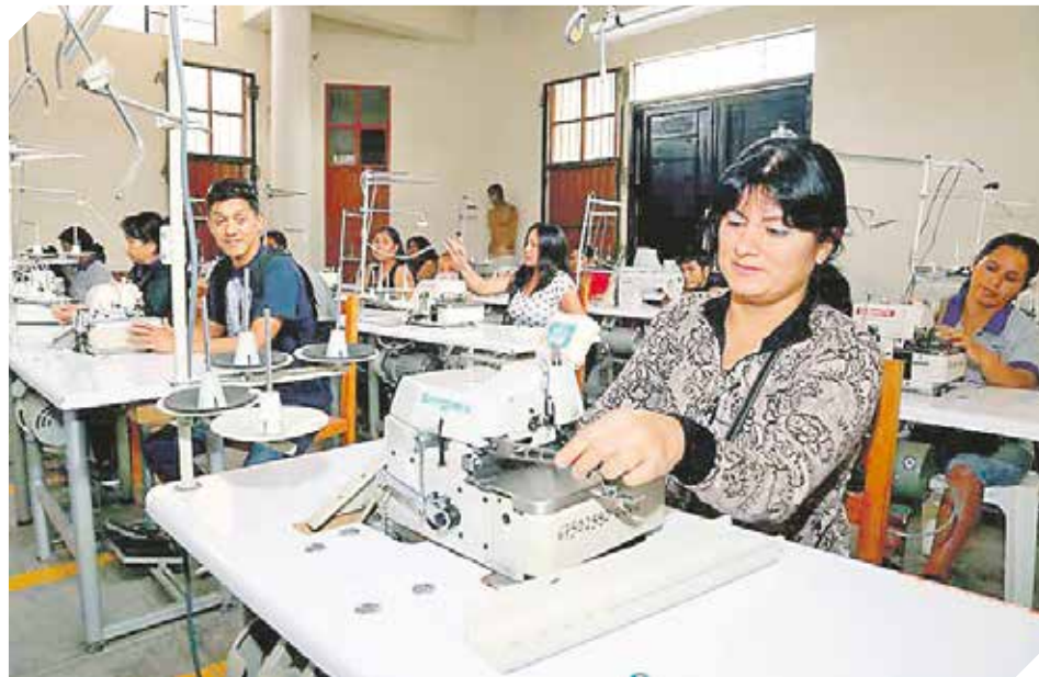
Los emprendedores reciben asesoramiento y capacitación constante.

tos indican que uno de los principales avances es el sistema de formalización de cada negocio. Cerca de 240.000 pequeñas y medianas están registradas en sistema tributario, cuentan con RUC. Sin embargo, existe un gran deber en proceso formal, solo 35.000 empresas cumplen con los parámetros establecidos por