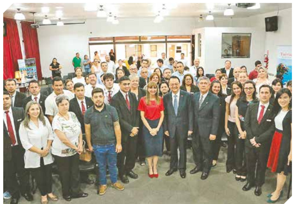
Alumnos y colaboradores realizaron el cierre de las actividades del año lectivo 2019.

Cabe destacar que durante el año 2019, 50 becarios paraguayos fueron capacitados en 7 cursos que fueron dictados en Taiwán por dos meses y medio, lo que representa una fuerte inversión económica y entrenamiento, en cada uno de ellos. Además de ello: La Universidad Politécnica Taiwán-Paraguay (UPTP), lanzó oficialmente las fechas de exámenes de ingreso para el 2020, la misma fue anunciada en una conferencia de prensa.