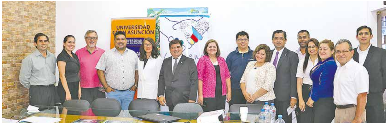
Representantes de ambas instituciones intercambiaron ideas y opiniones luego de la firma del acuerdo.

Todo esto forma parte de una alianza entre varias universidades latinoamericanas y europeas, que buscan lograr la movilidad estudiantil internacional con la implementación de créditos universitarios, por medio de los 4 criterios: aprendizaje centrado en estu-