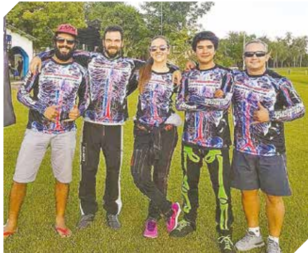
Elaboran indumentarias para los deportes extremos.

● La empresa cumple en acompañar los encuentros y actividades diaras con prendas de calidad.