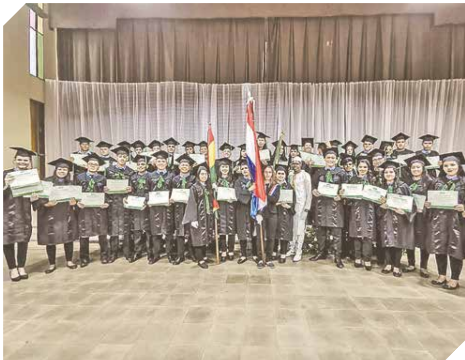
Graduados y autoridades de la Fundación Paraguaya tras el acto oficial.

La institución educativa culminó el periodo lectivo 2019, con la graduación de casi medio centenar de emprendedores rurales.