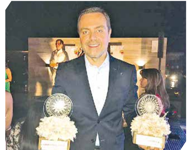
El talento, la entrega y el trabajo bien hecho fueron fundamentales en la premiación.

El trabajo, la dedicación y la calidad presentada en cada producto y artículo fueron premiados en una interesante noche de gala.