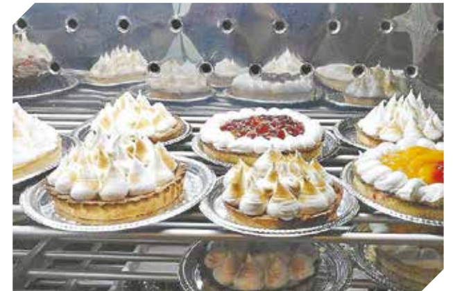
Las más ricas tortas para todo tipo de acontecimiento.

El buen sabor, la calidad, la utilización de productos de primer nivel son el sello de garantía.