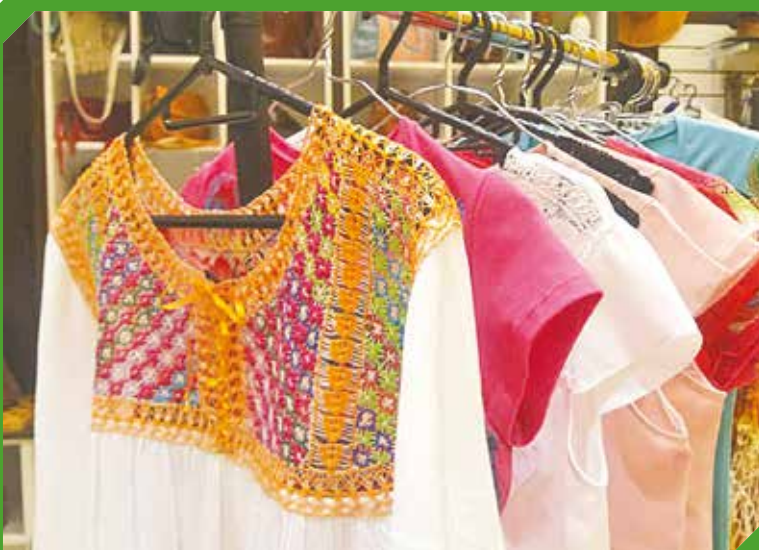
Las prendas se caracterizan por su sobriedad y elegancia.

El ñanduti es parte de la cultura paraguaya.