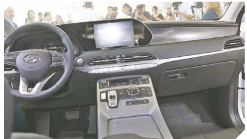
Pantalla táctil. Navegador compatible con Apple, CarPlay y Android.