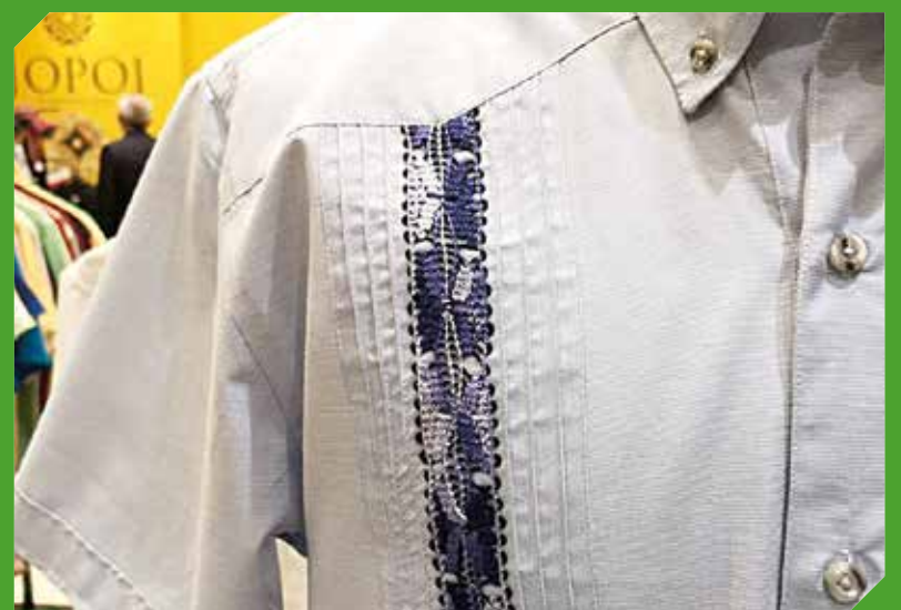
Camisas ideales para el uso en oficinas o eventos especiales.

“Lo que más me gusta de trabajar es ver una idea en la mente plasmada en el producto final”.