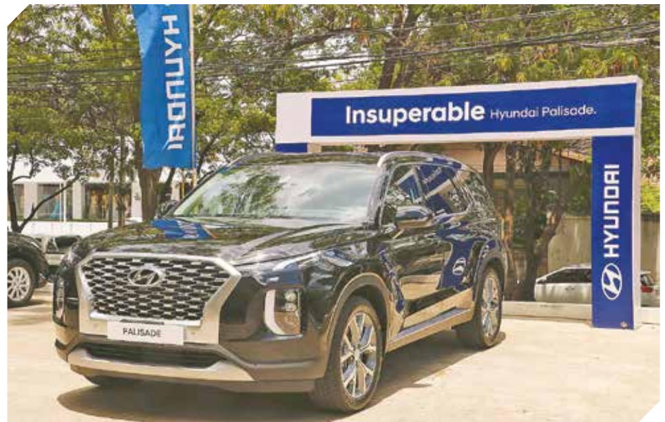
Hyundai Palisade 2020. Es un modelo Premium insuperable en el mercado.

Está presente en Showrooms de Asunción. Para más información, se puede acceder a las redes de Hyundai Paraguay.