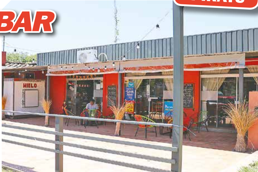
Un cómodo lugar donde pasar momentos agradables con la familia y amigos.

● Un abanico de exquisitos platos, tragos y un cómodo lugar donde compartir con los amigos y la familia forma parte de la imperdible puesta para todos los visitantes.