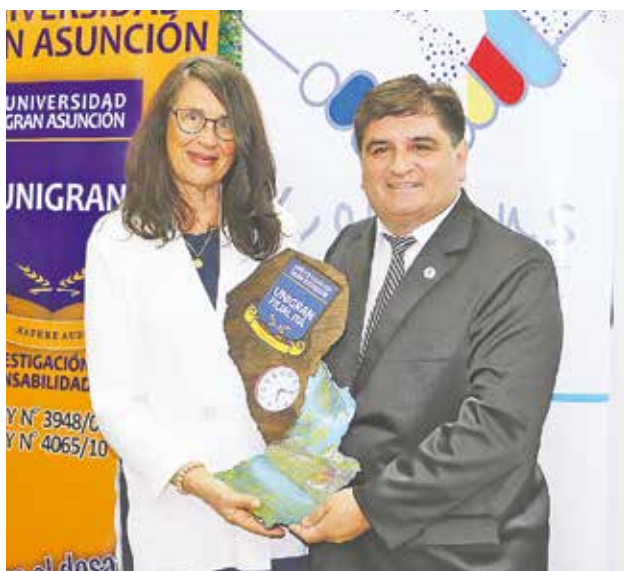
Entrega de obsequio a la representante Francesa.