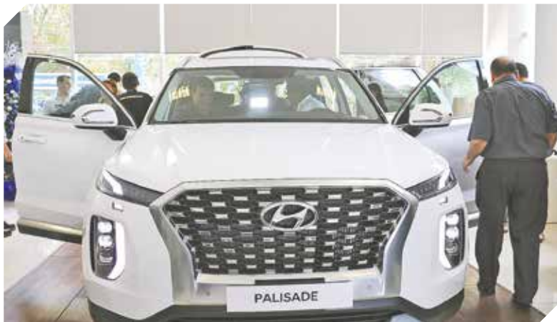
Elegancia y comodidad, características del Hyundai Palisade 2020.

El nuevo modelo 2020 incluye tecnología centrada en la conectividad y la asistencia en la conducción.